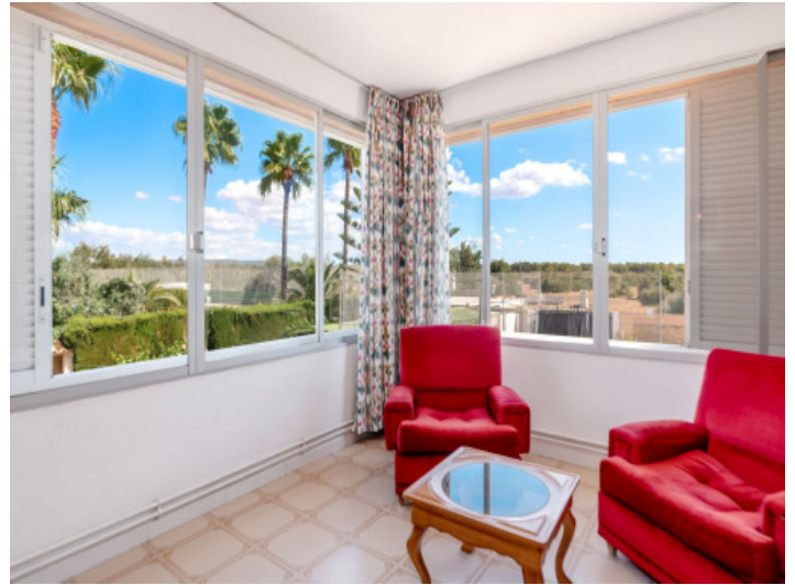
Salita dormitorio principal