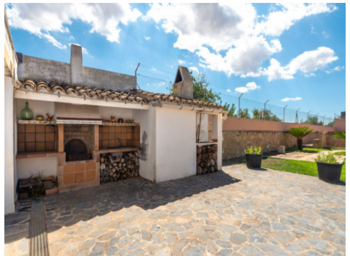
Area de barbacoa

Toda la información como mejor se puede saber, salvo por error durante el periodo de venta. Sirva este documento como un informe previo, las bases legales solo serán validas a traves de un contrato de compra acordado ante Notario.