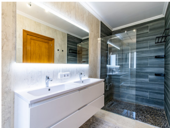
Baño con ducha