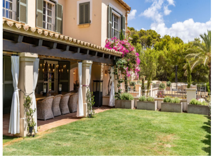
Villa con mucha privacidad