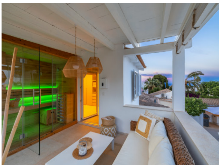
Sauna con vistas al mar