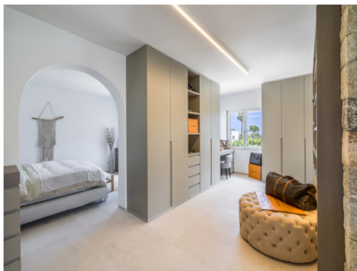
Dormitorio con armario empotrado