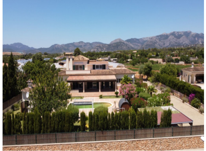
Vista a la propiedad