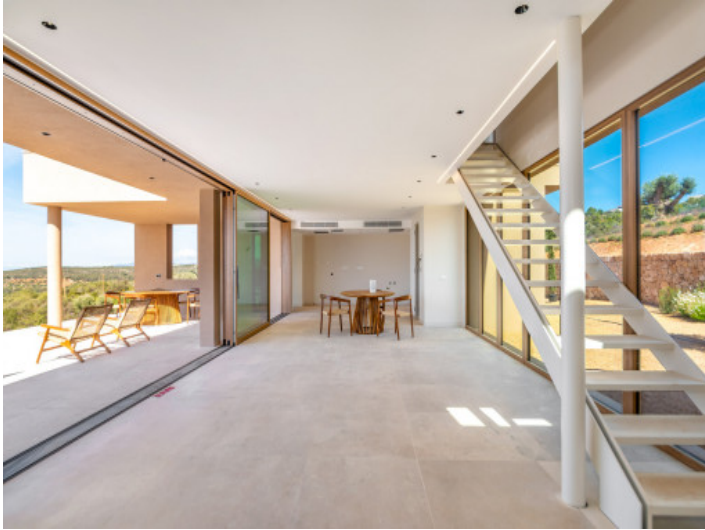
Salón - Comedor