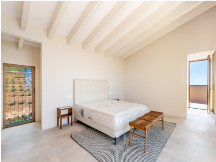
Uno de 4 dormitorios