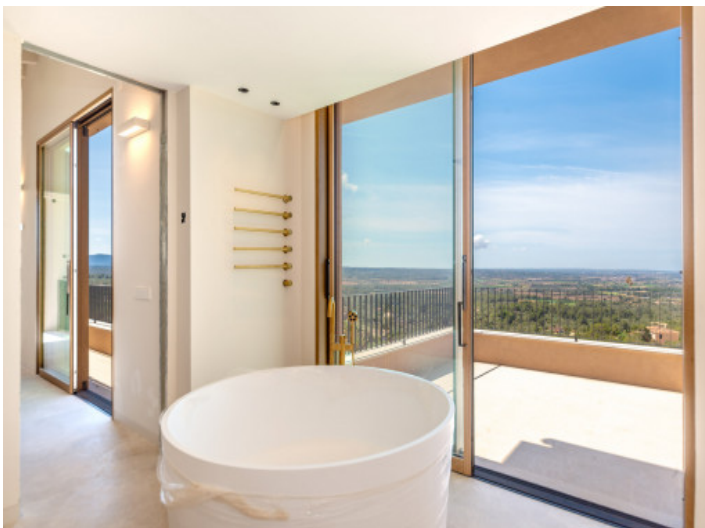
Baño en suite