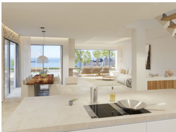
Salón y cocina abierta