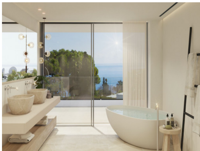
Baño con bañera

Toda la información como mejor se puede saber, salvo por error durante el periodo de venta. Sirva este documento como un informe previo, las bases legales solo serán válidas a través de un contrato de compra acordado ante Notario.