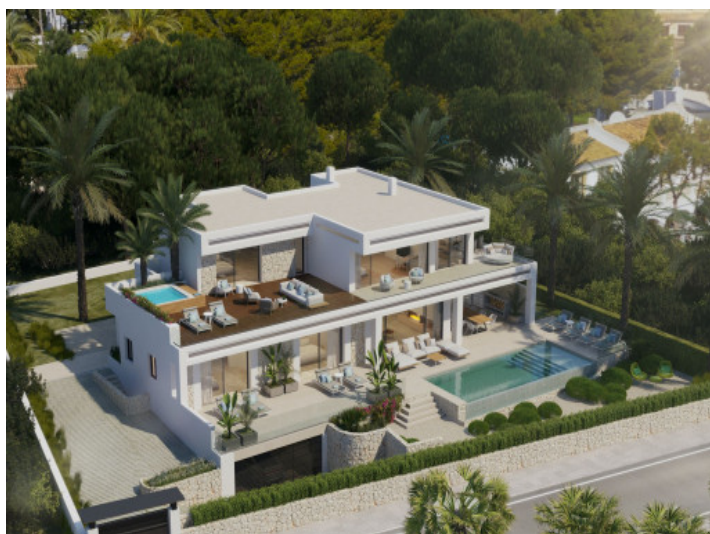
Vista exterior de la villa