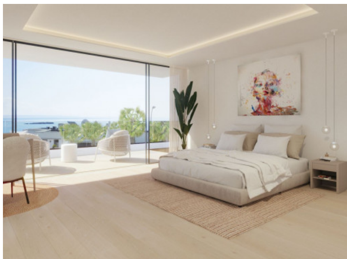
Dormitorio principal con baño en suite