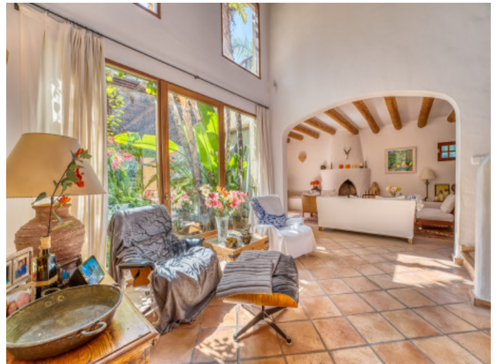
Área de relajarse

Toda la información como mejor se puede saber, salvo por error durante el periodo de venta. Sirva este documento como un informe previo, las bases legales solo serán válidas a través de un contrato de compra acordado ante Notario.