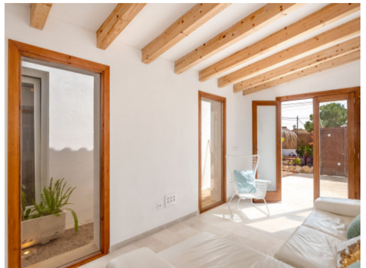
Zona de invitados

Toda la información como mejor se puede saber, salvo por error durante el periodo de venta. Sirva este documento como un informe previo, las bases legales solo serán válidas a través de un contrato de compra acordado ante Notario.