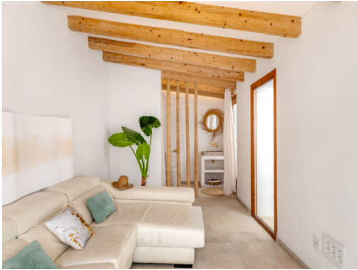
Zona de invitados