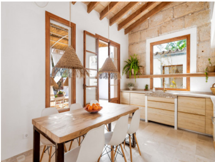
Comedor y cocina