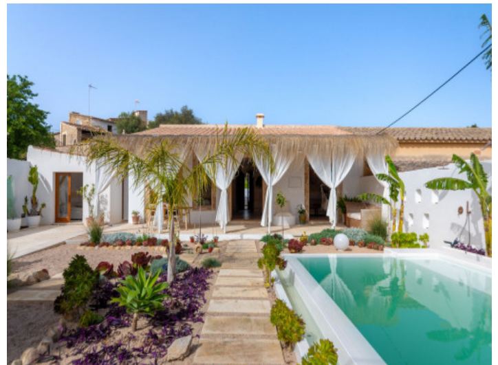
Estupendo chalet con piscina y jardín en Establiments