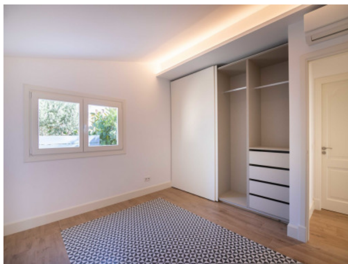
Uno de 6 dormitorios