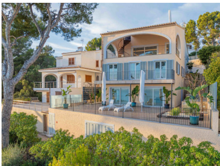
Fachada orientado al sur