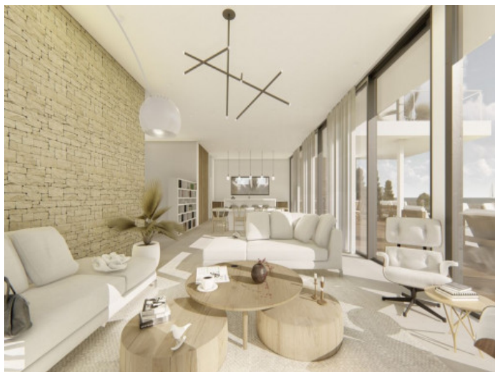
Elegante área de estar