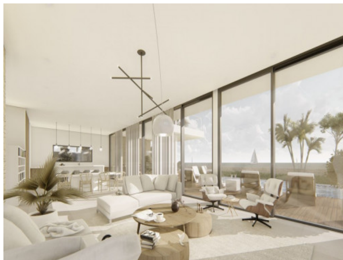
Área de estar con vistas al mar