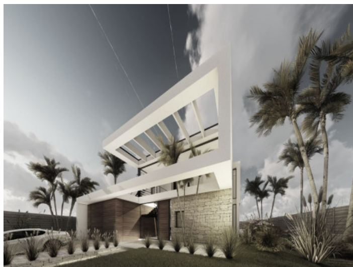
Entrada y jardín

Toda la información como mejor se puede saber, salvo por error durante el periodo de venta. Sirva este documento como un informe previo, las bases legales solo serán válidas a través de un contrato de compra acordado ante Notario.