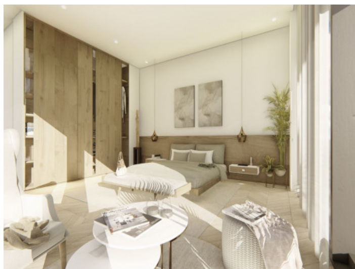
Dormitorio inundado de luz