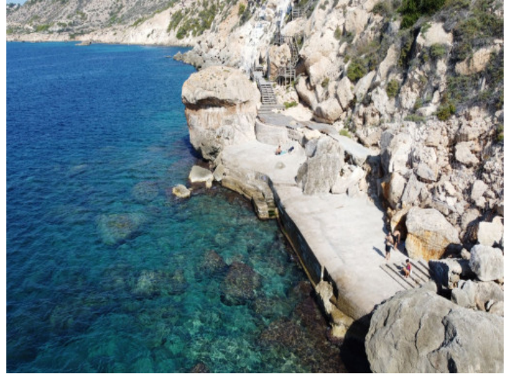
Acceso al mar