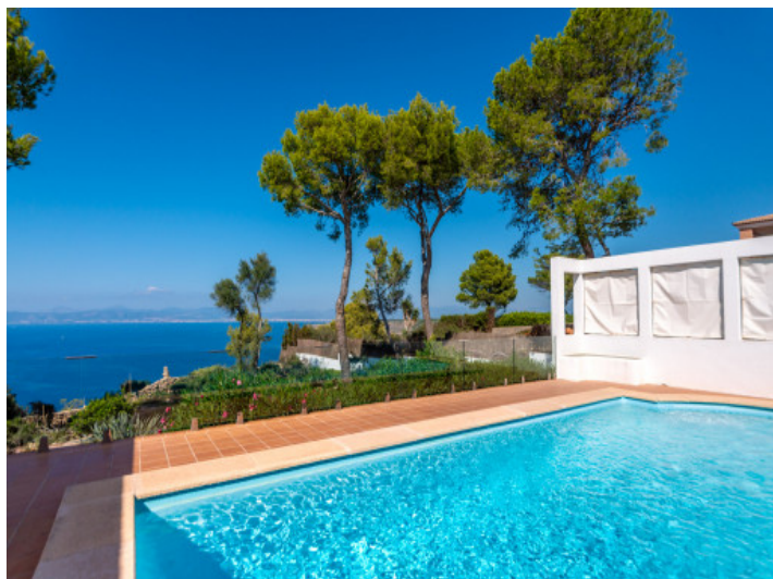
Piscina y vistas al mar