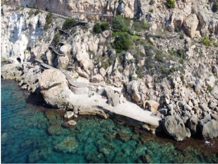
Acceso al mar