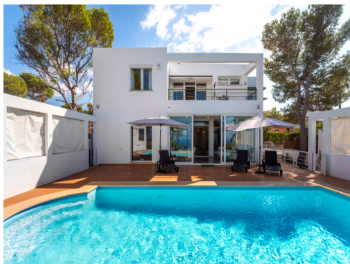
Chalet y piscina