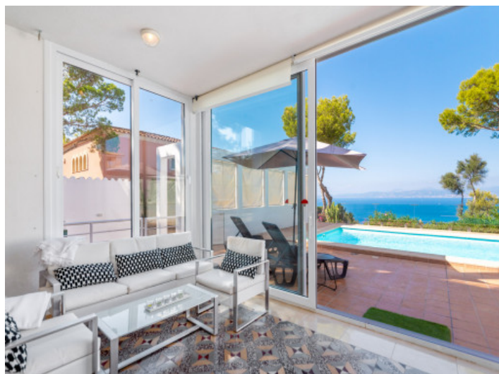
Jardín de invierno

Toda la información como mejor se puede saber, salvo por error durante el periodo de venta. Sirva este documento como un informe previo, las bases legales solo serán válidas a través de un contrato de compra acordado ante Notario.