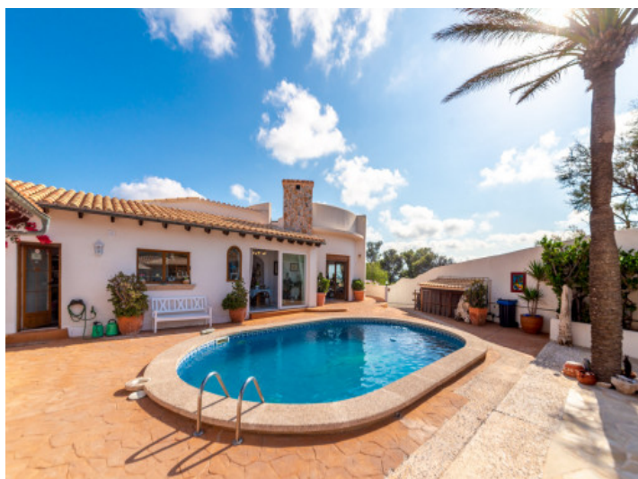
Zona de piscina