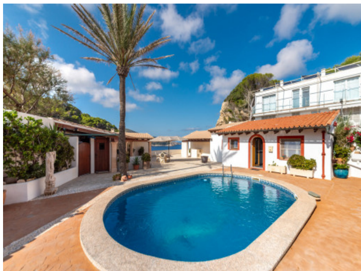
Zona de piscina