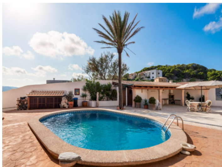
Zona de piscina