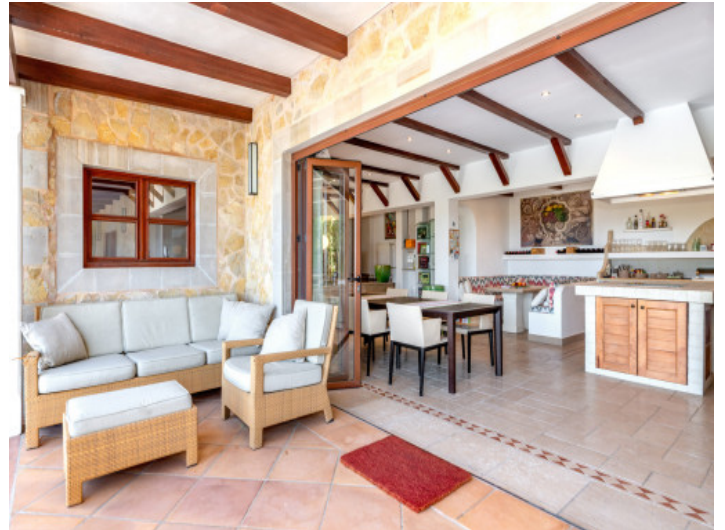
Zona de lounge