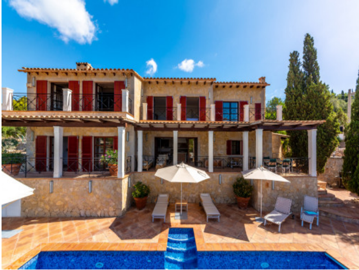
Villa y piscina