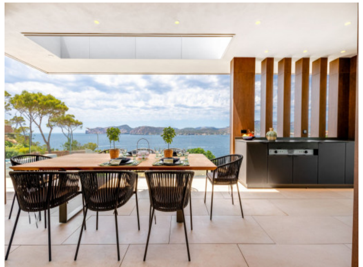
Comedor en la terraza