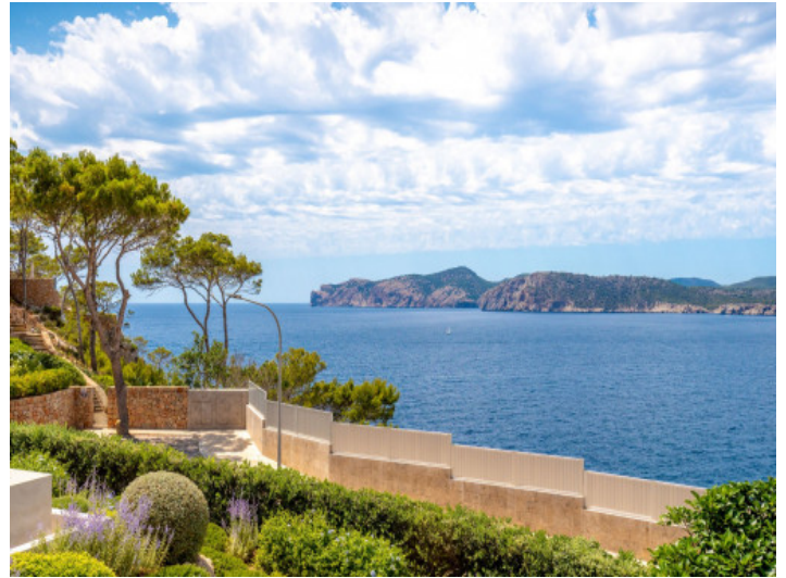
Vistas al mar