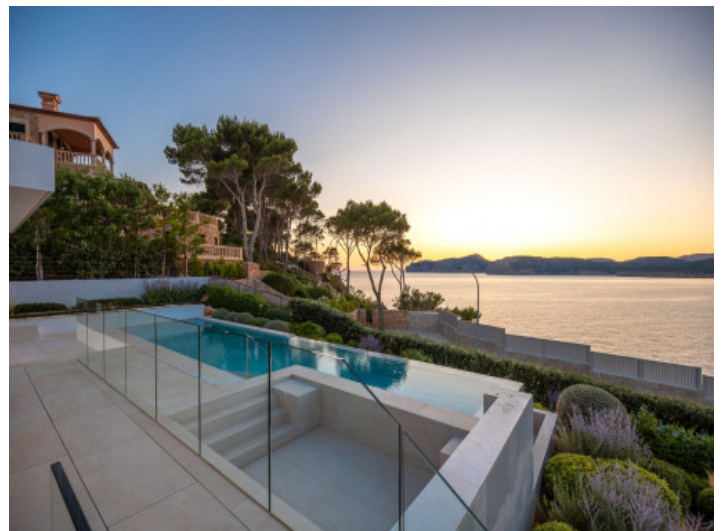
Vistas al mar

Toda la información como mejor se puede saber, salvo por error durante el periodo de venta. Sirva este documento como un informe previo, las bases legales solo serán válidas a través de un contrato de compra acordado ante Notario.