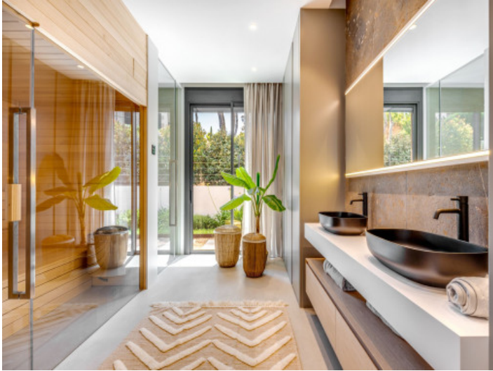
Baño y sauna