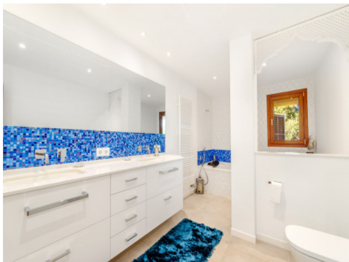
Uno de 5 baños