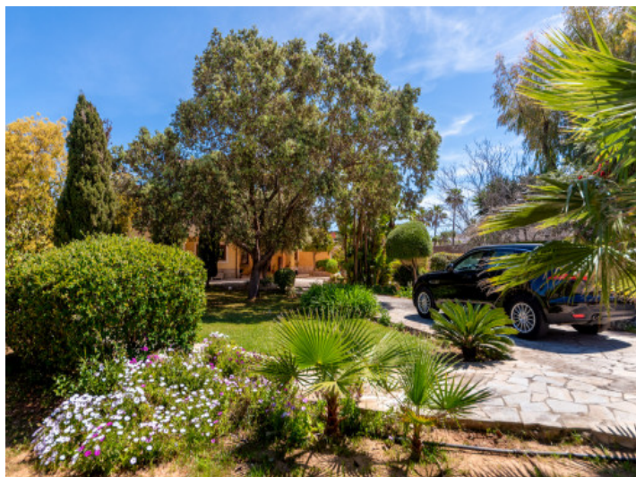
Jardín y vista exterior