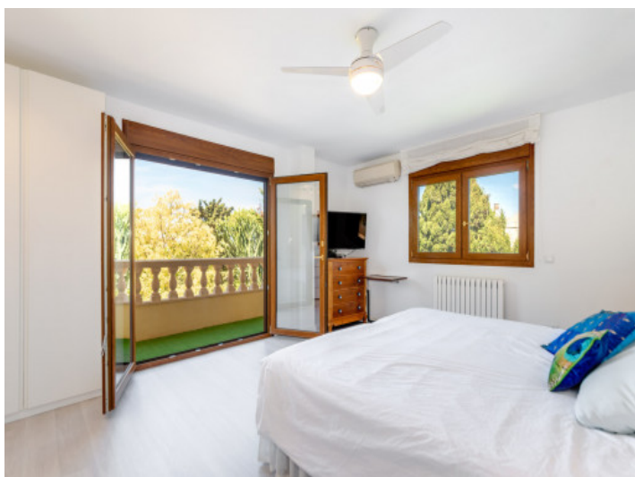
Uno de 5 dormitorios