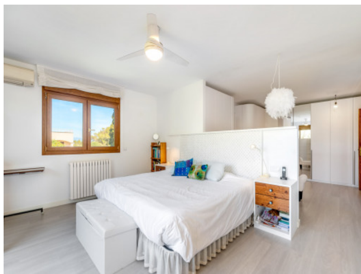
Uno de 5 dormitorios