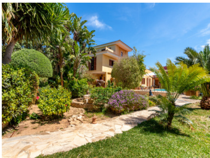
Jardín y vista exterior