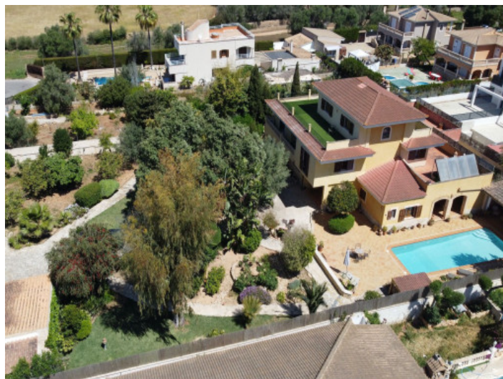
Villa con piscina en Lluçmajor