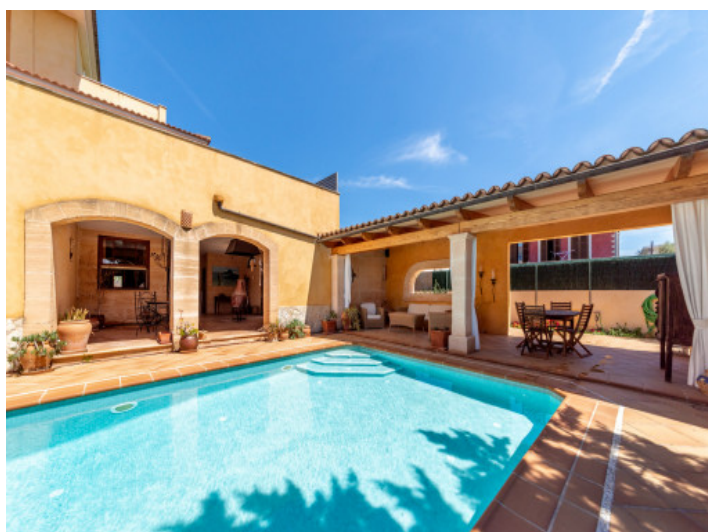
Piscina y terraza cubierta