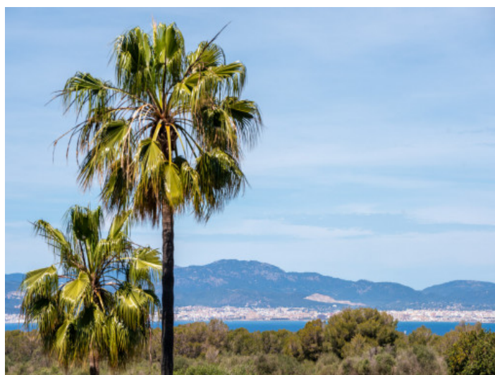
Vista al mar

Toda la información como mejor se puede saber, salvo por error durante el periodo de venta. Sirva este documento como un informe previo, las bases legales solo serán válidas a través de un contrato de compra acordado ante Notario.