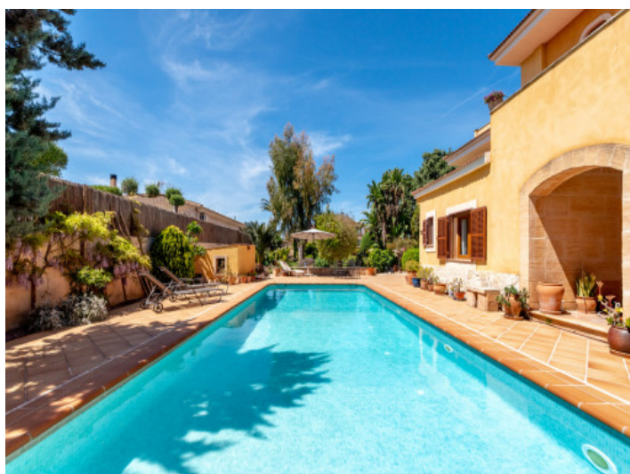
Vista a la piscina y jardín