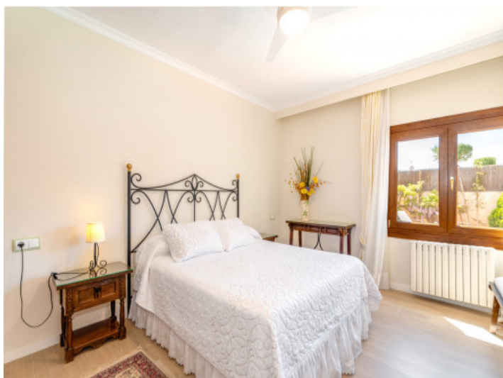
Uno de 5 dormitorios