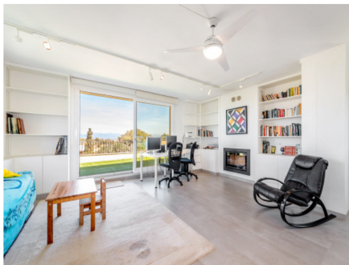
Dormitorio con terraza

Toda la información como mejor se puede saber, salvo por error durante el periodo de venta. Sirva este documento como un informe previo, las bases legales solo serán válidas a través de un contrato de compra acordado ante Notario.