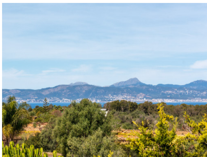
Vista al mar

Toda la información como mejor se puede saber, salvo por error durante el periodo de venta. Sirva este documento como un informe previo, las bases legales solo serán validas a traves de un contrato de compra acordado ante Notario.