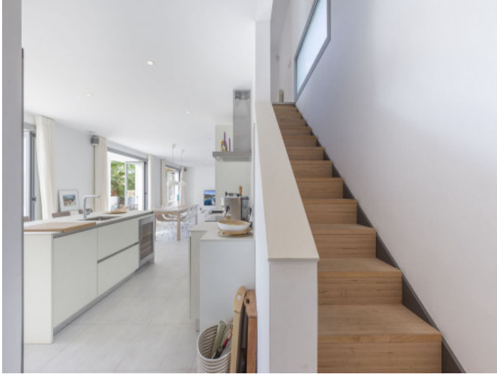
Acceso a la planta superior