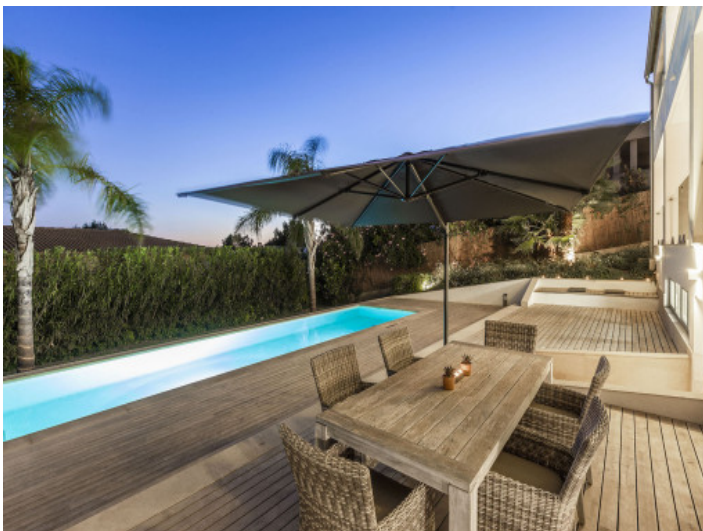
Terraza por la noche