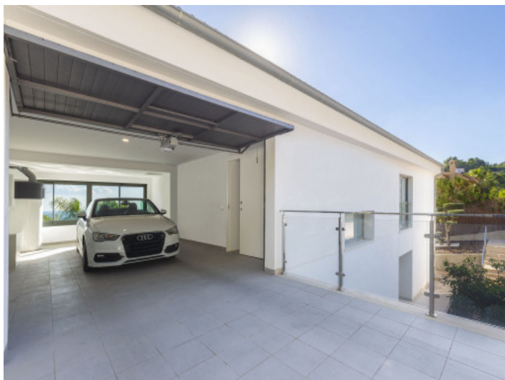
Garaje de la villa