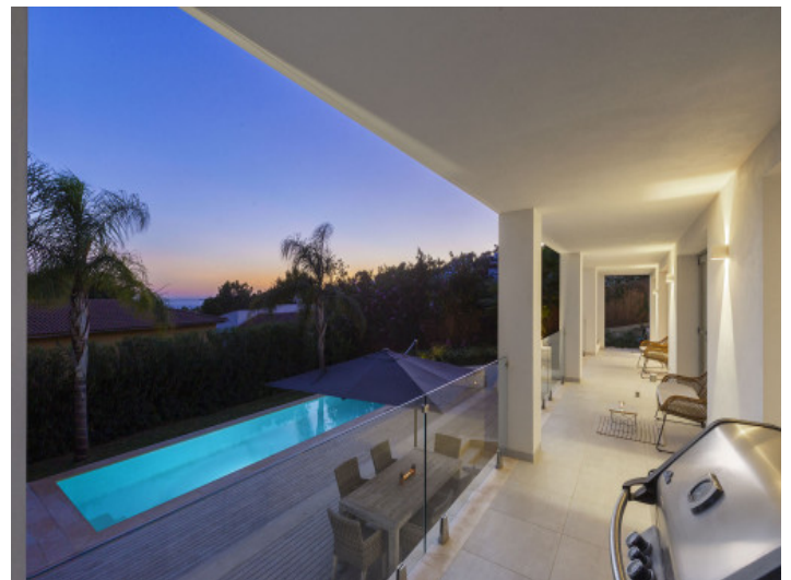
Balcón por la noche

Toda la información como mejor se puede saber, salvo por error durante el periodo de venta. Sirva este documento como un informe previo, las bases legales solo serán válidas a través de un contrato de compra acordado ante Notario.