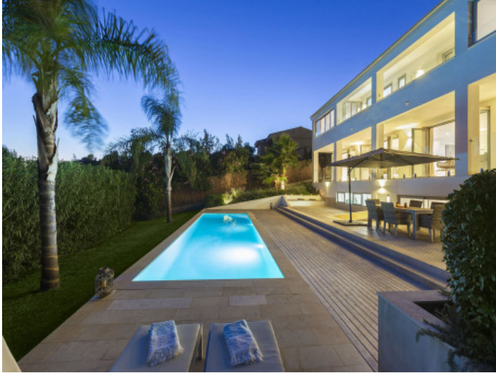
Piscina por la noche