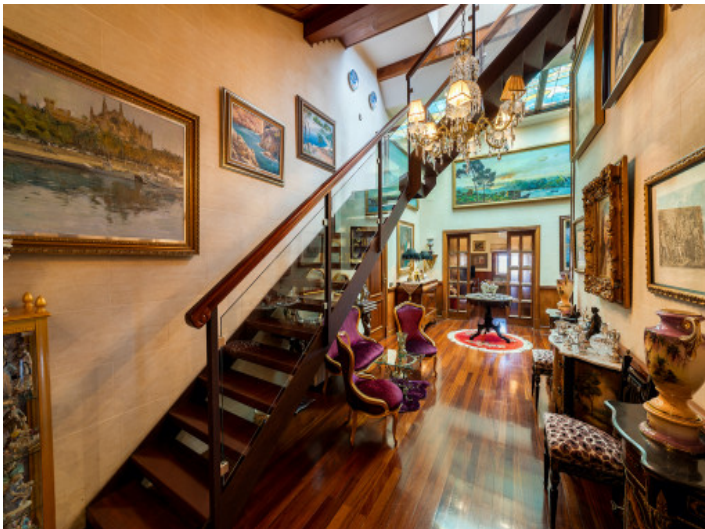
Hall planta superior