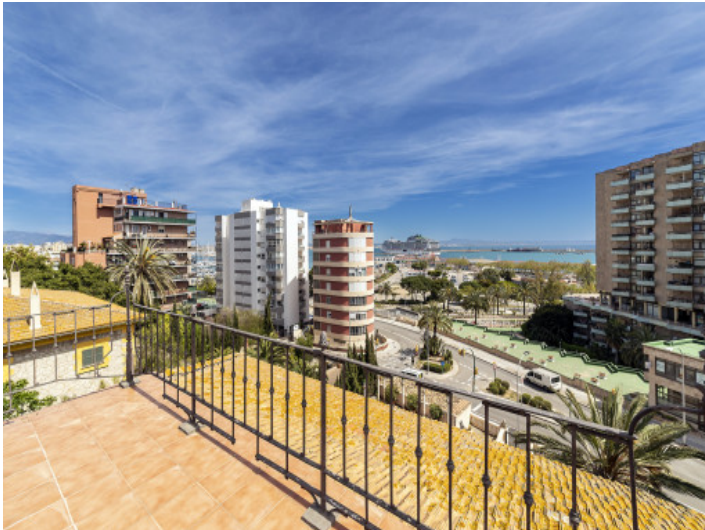
Terraza con vistas al mar