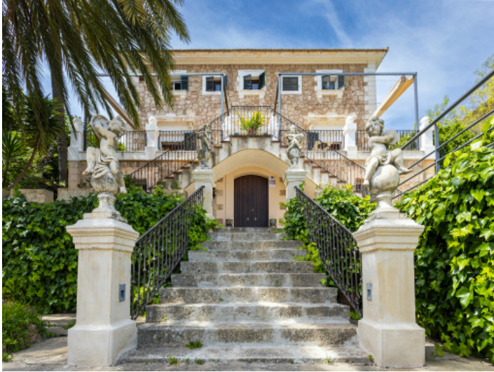
Vista exterior y acceso