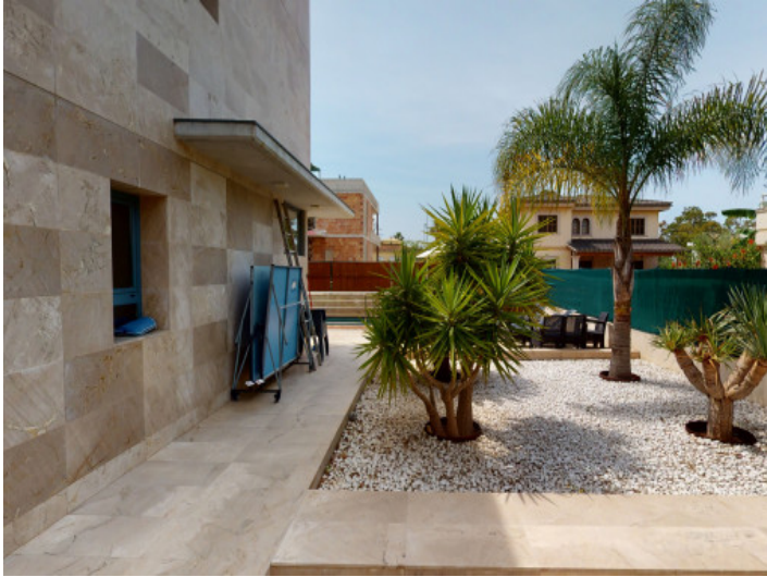
Acceso y jardín