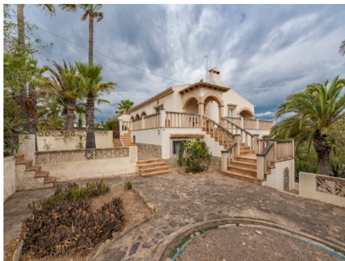
Vista exterior de la villa

Toda la información como mejor se puede saber, salvo por error durante el periodo de venta. Sirva este documento como un informe previo, las bases legales solo serán válidas a través de un contrato de compra acordado ante Notario.