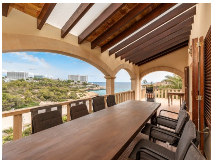
Comedor en el balcón