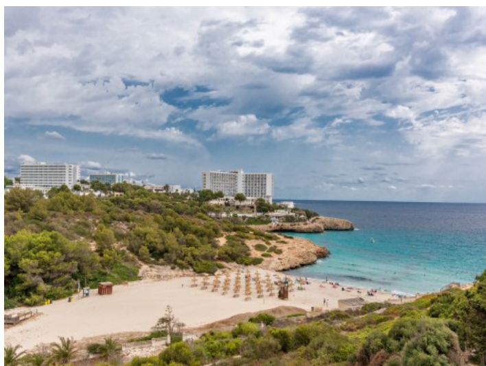
Vista a la Cala Murada