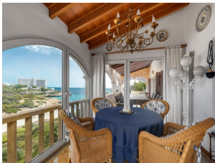
Zonas de comedor separadas