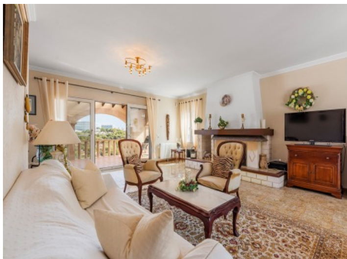
Acogedora sala de estar grande