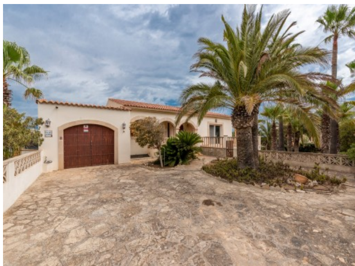
Garaje y entrada