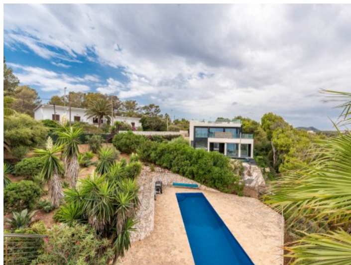
Vista a la piscina