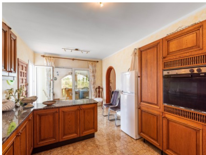
Cocina rústica de madera

Toda la información como mejor se puede saber, salvo por error durante el periodo de venta. Sirva este documento como un informe previo, las bases legales solo serán válidas a través de un contrato de compra acordado ante Notario.