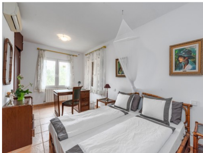
Segundo dormitorio doble