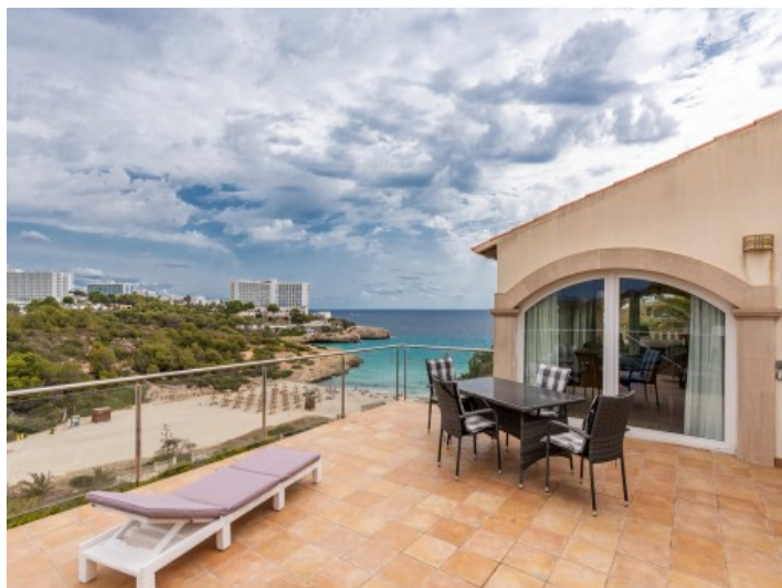
Terraza con una vista al mar