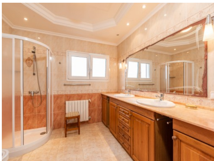
Baño grande con ducha