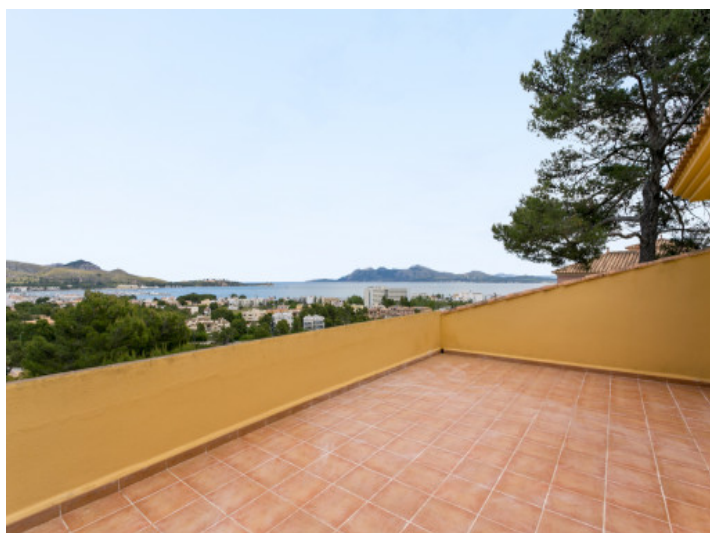
Fantástico chalet con vistas al mar en Puerto de Pollença