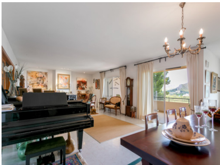
Salón-comedor con vistas a las montañas