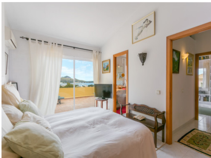
Dormitorio inundado de luz