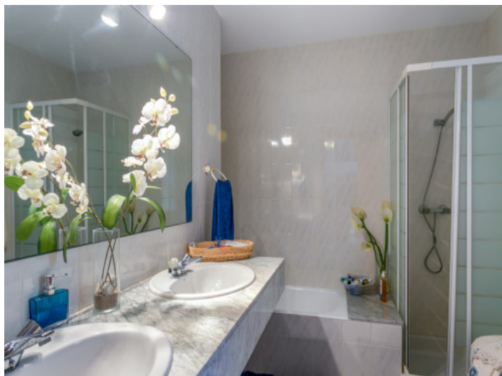
Uno de 3 baños