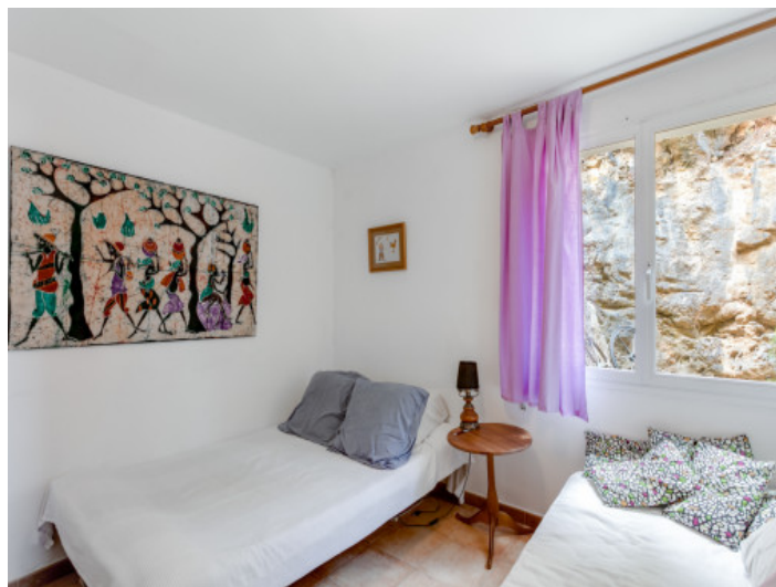
Dormitorio con 2 camas