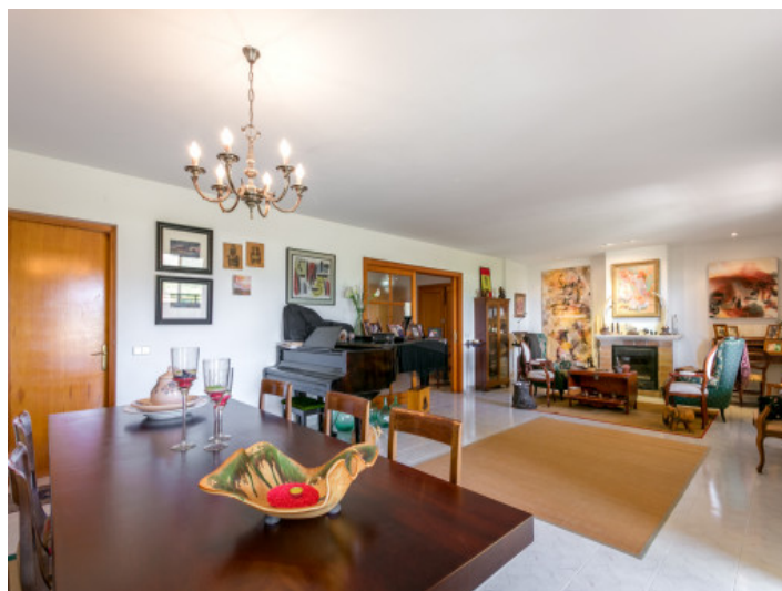
Salón-comedor con chimenea

Toda la información como mejor se puede saber, salvo por error durante el periodo de venta. Sirva este documento como un informe previo, las bases legales solo serán válidas a través de un contrato de compra acordado ante Notario.