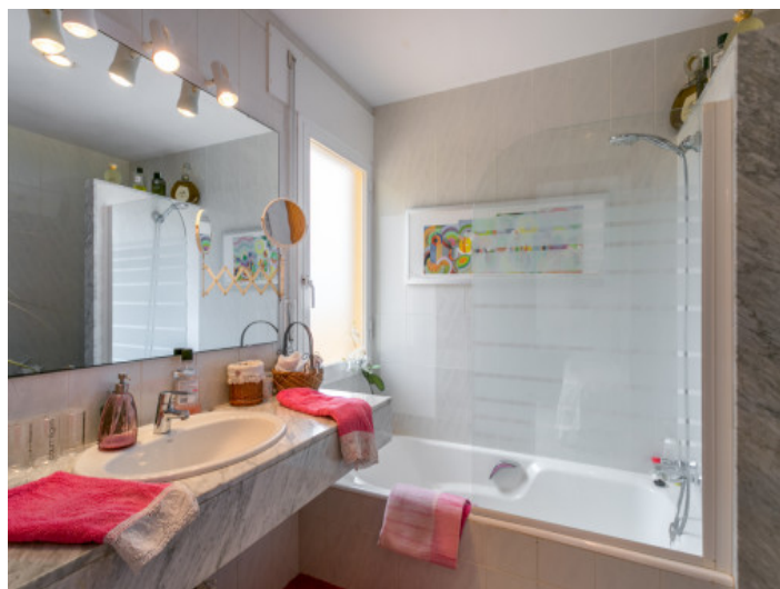
Uno de 3 baños

Toda la información como mejor se puede saber, salvo por error durante el periodo de venta. Sirva este documento como un informe previo, las bases legales solo serán válidas a través de un contrato de compra acordado ante Notario.