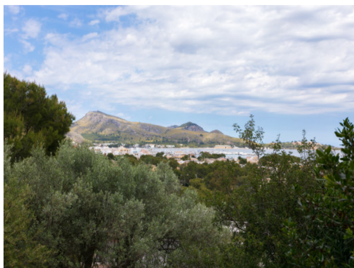
Impresionantes vistas al mar

Toda la información como mejor se puede saber, salvo por error durante el periodo de venta. Sirva este documento como un informe previo, las bases legales solo serán válidas a través de un contrato de compra acordado ante Notario.