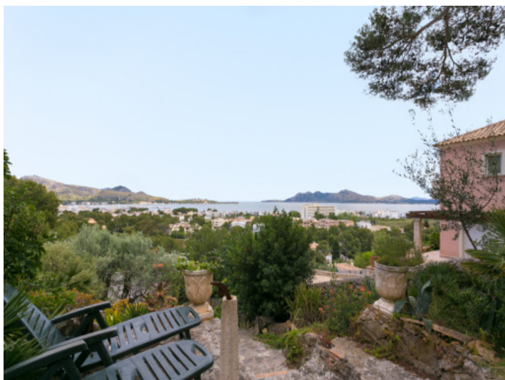
Terraza con vistas panorámicas