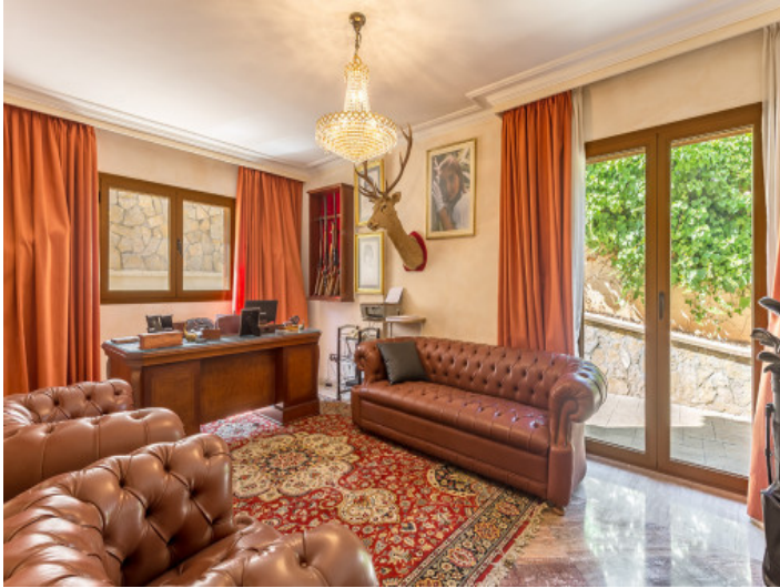
Oficina con zona de asientos y acceso al exterior