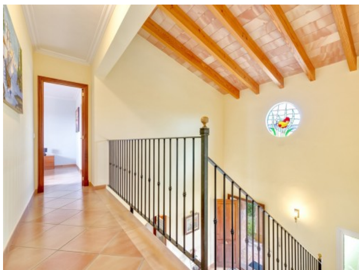
Escalera a la planta superior