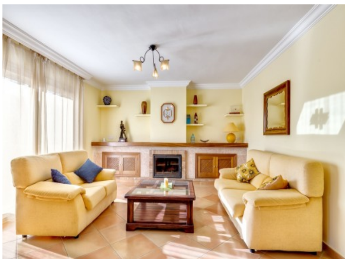
Área de estar acogedora