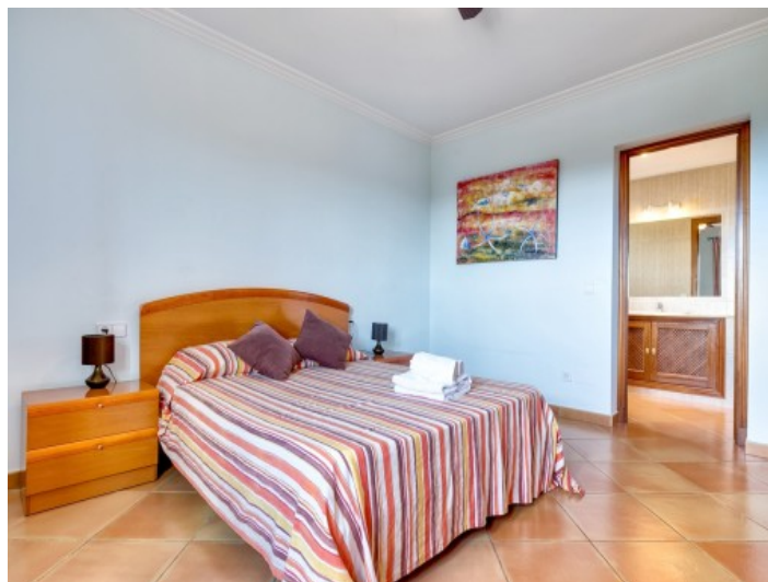
Dormitorio doble con baño en suite