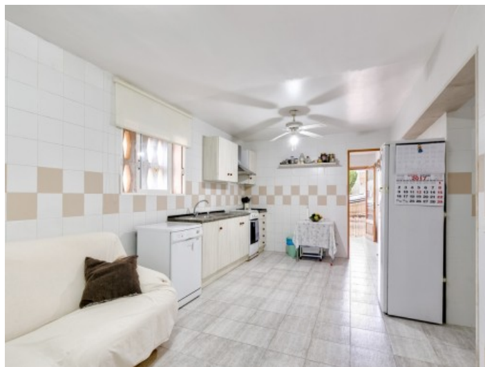
Segunda cocina totalmente equipada