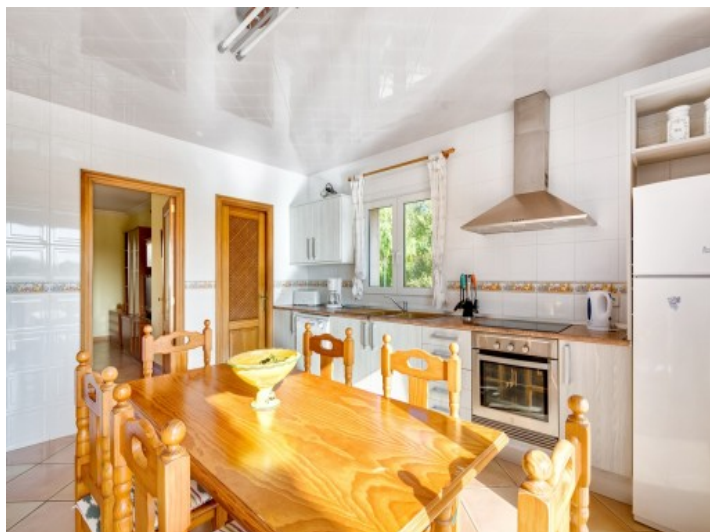
Cocina inundada de luz con comedor