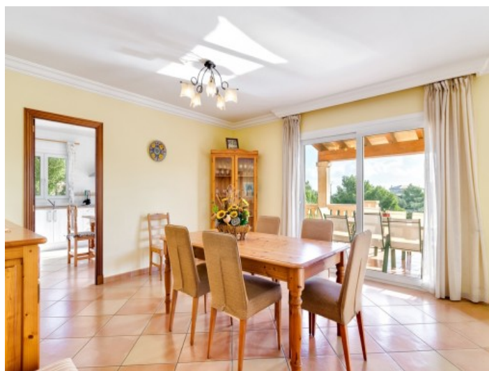
Comedor luminoso con acceso a la terraza