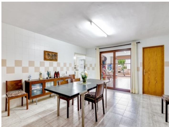
Un otro comedor