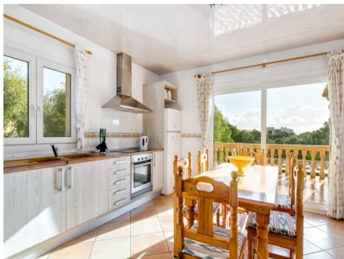
Cocina totalmente equipada

Toda la información como mejor se puede saber, salvo por error durante el periodo de venta. Sirva este documento como un informe previo, las bases legales solo serán válidas a través de un contrato de compra acordado ante Notario.