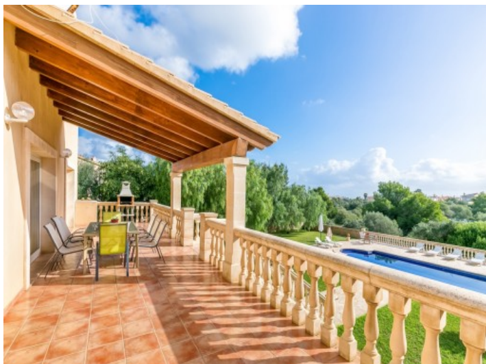
Terraza grande con vistas al jardín y a la piscina