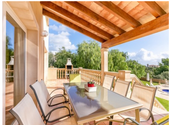
Terraza cubierta con zona de estar y zona de barbacoa