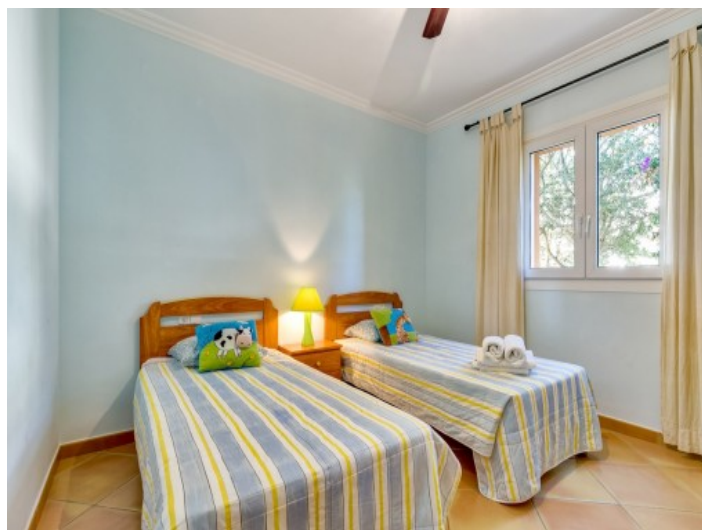
Cuarto de niños con 2 camas

Toda la información como mejor se puede saber, salvo por error durante el periodo de venta. Sirva este documento como un informe previo, las bases legales solo serán válidas a través de un contrato de compra acordado ante Notario.