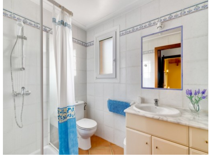
Baño con ducha