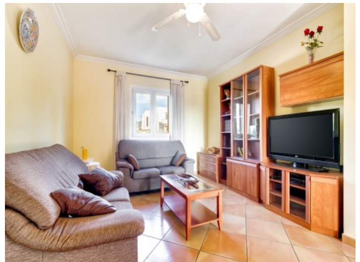
Segunda área de estar

Toda la información como mejor se puede saber, salvo por error durante el periodo de venta. Sirva este documento como un informe previo, las bases legales solo serán válidas a través de un contrato de compra acordado ante Notario.