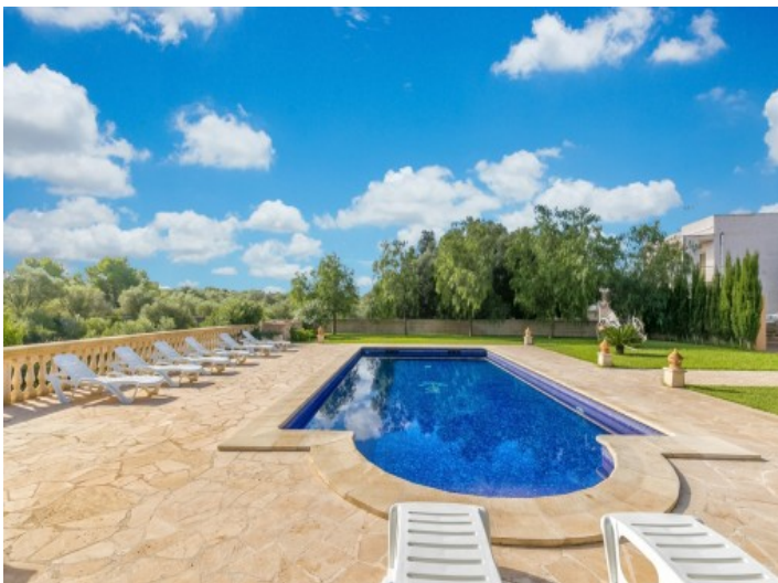
Piscina y jardín fantásticos