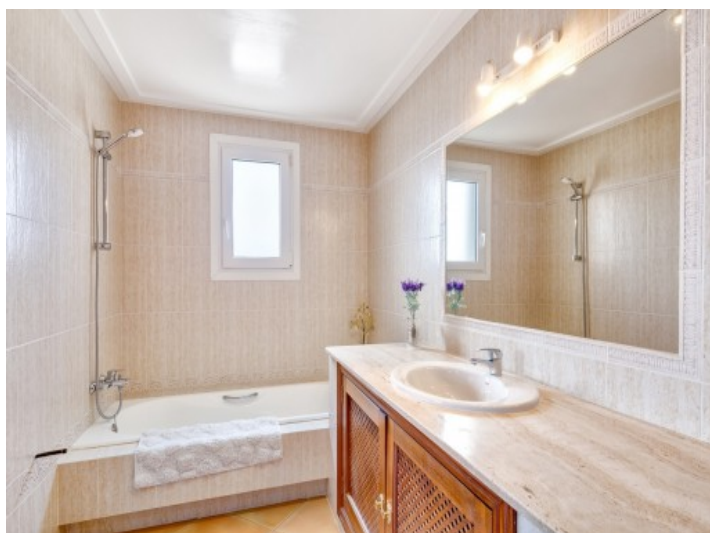
Baño en suite con bañera y luz natural