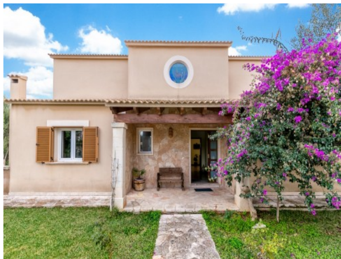
Vistas de la fachada y entrada a la propiedad