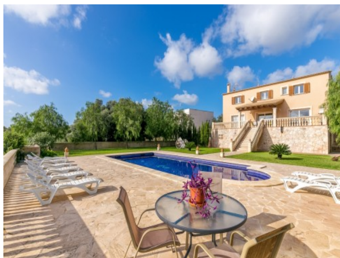
Jardín y piscina idílicos con zonas de estar