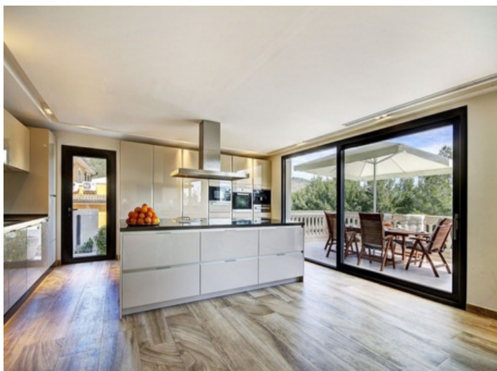
Una de 2 cocinas con acceso al balcón