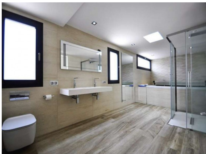
Baño espacioso con bañera cómoda y ducha