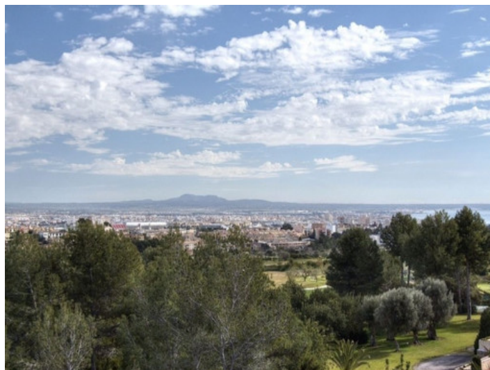
Vistas panorámicas a los alrededores y al mar