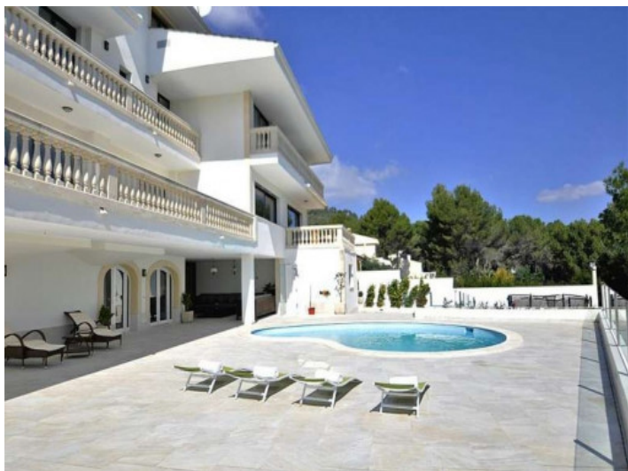
Mucho espacio para relajarse