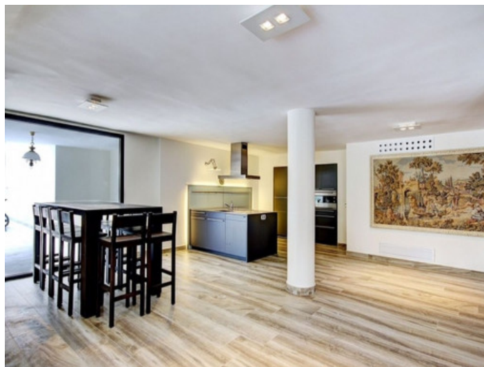
Comedor abierto y cocina