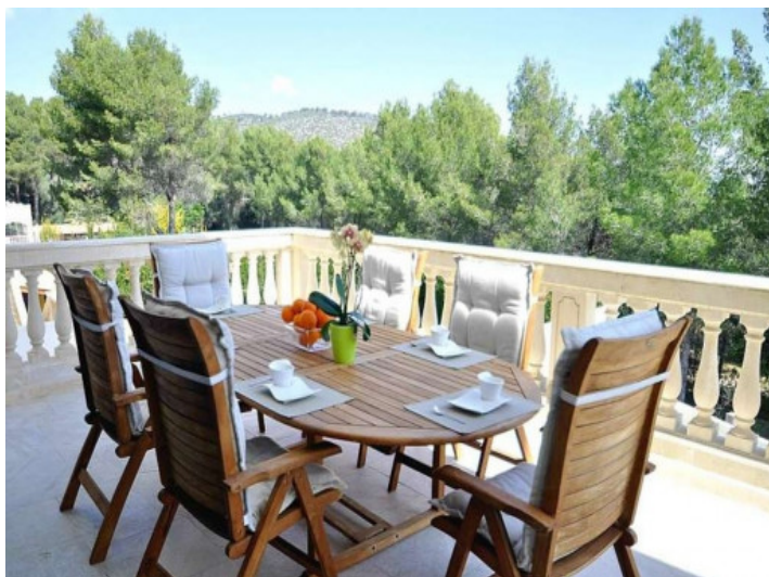
Comedor bonito en el balcón