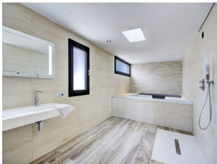
Baño con luz natural

Toda la información como mejor se puede saber, salvo por error durante el periodo de venta. Sirva este documento como un informe previo, las bases legales solo serán válidas a través de un contrato de compra acordado ante Notario.