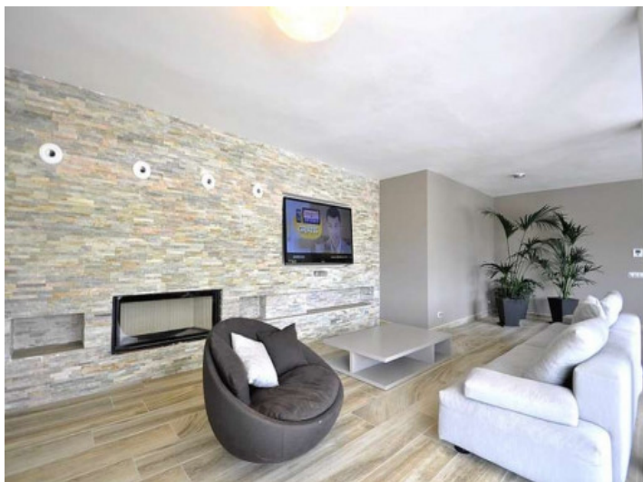
Zona de estar acogedora