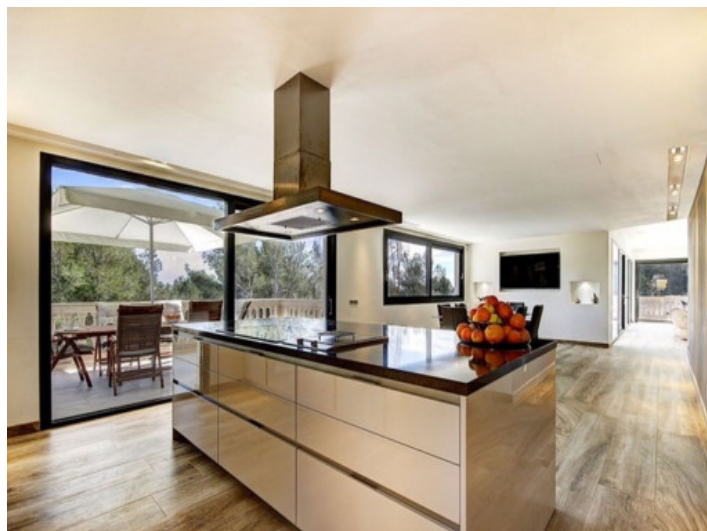
Cocina con isla central moderna