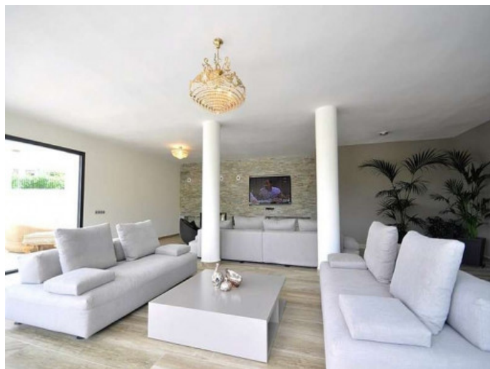
Área de estar lujosa