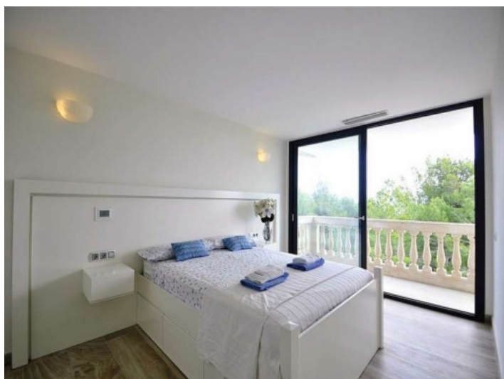
Dormitorio con vistas sobre los alrededores