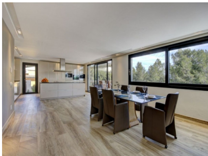
Segundo comedor abierto y cocina

Toda la información como mejor se puede saber, salvo por error durante el periodo de venta. Sirva este documento como un informe previo, las bases legales solo serán válidas a través de un contrato de compra acordado ante Notario.