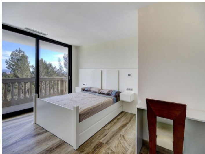
Dormitorio doble con acceso al balcón