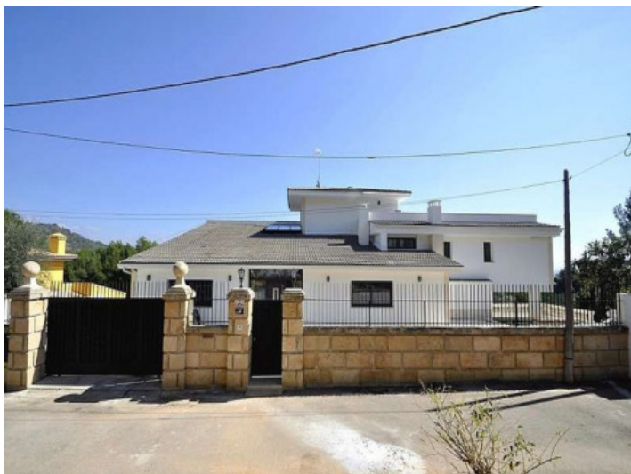
Vista exterior de la propiedad