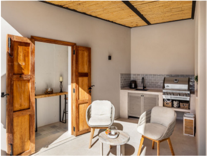
Zona de barbacoa