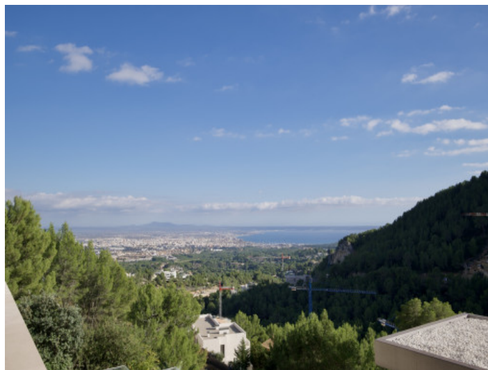
Vistas al campo