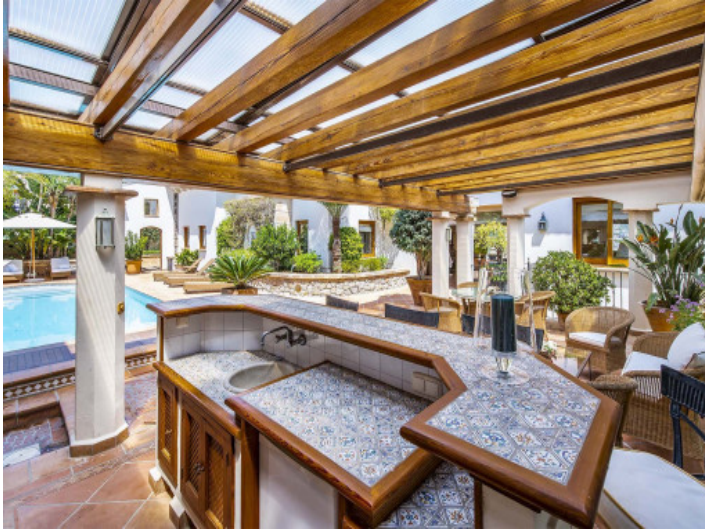
Terraca con zona de barbacoa