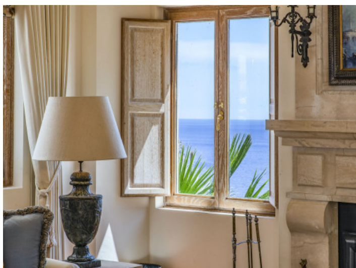
Vista al mar