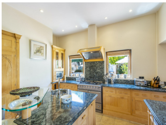
Cocina totalmente equipada

Toda la información como mejor se puede saber, salvo por error durante el periodo de venta. Sirva este documento como un informe previo, las bases legales solo serán válidas a través de un contrato de compra acordado ante Notario.