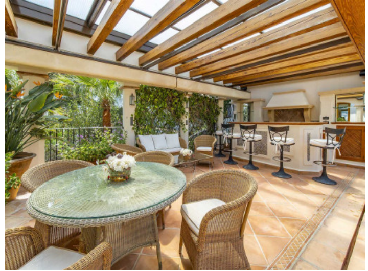
Terraca con zona de barbacoa