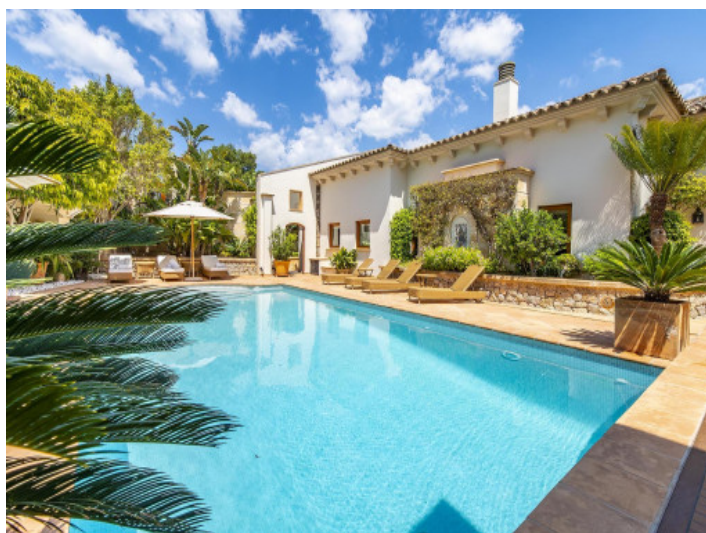
Vista exterior de la villa