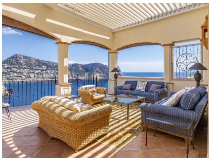
Terraza con vistas al mar