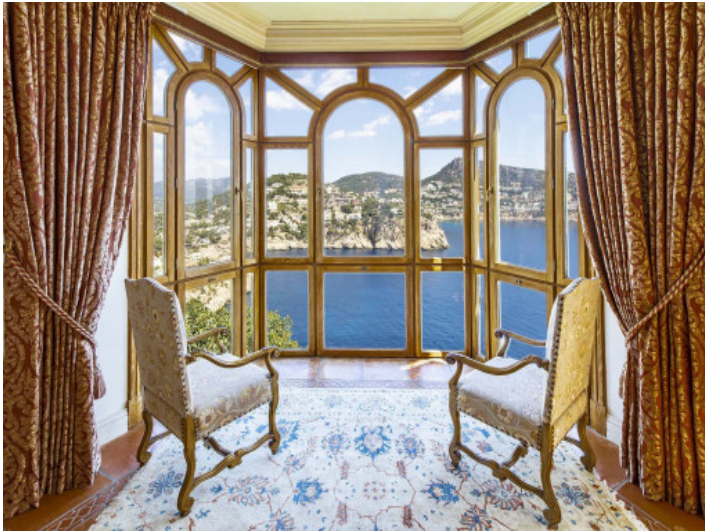
Vista del comedor