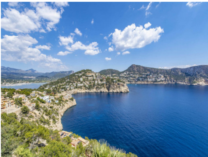
Vista a La Mola