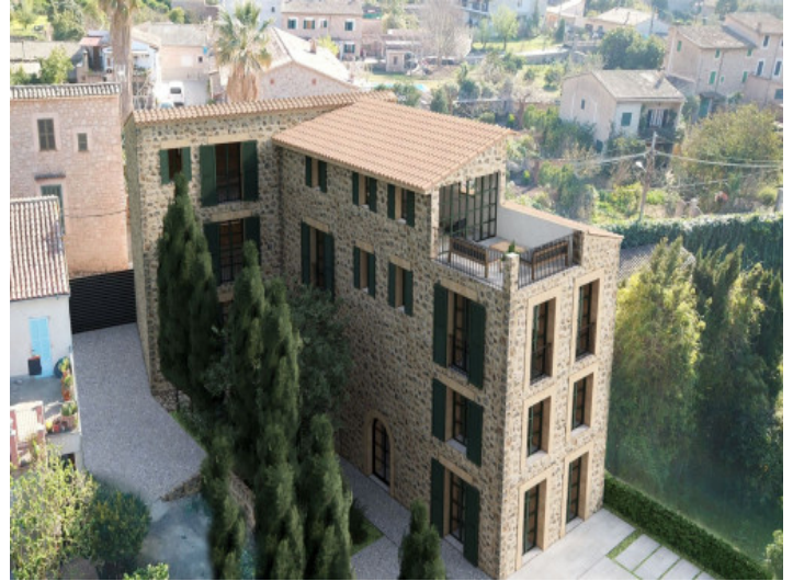
Vista desde arriba