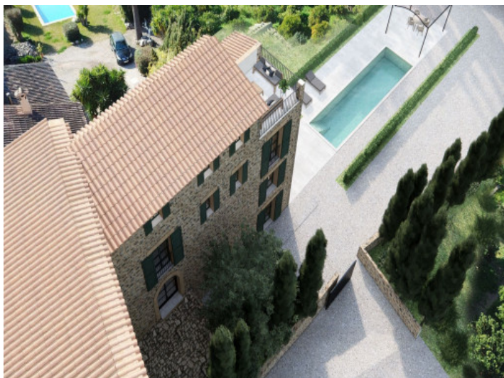
Piscina y área exterior