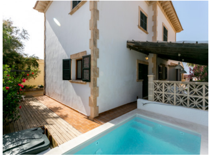
Terraza con piscina pequeña