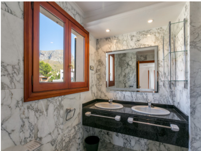
Uno de 3 baños