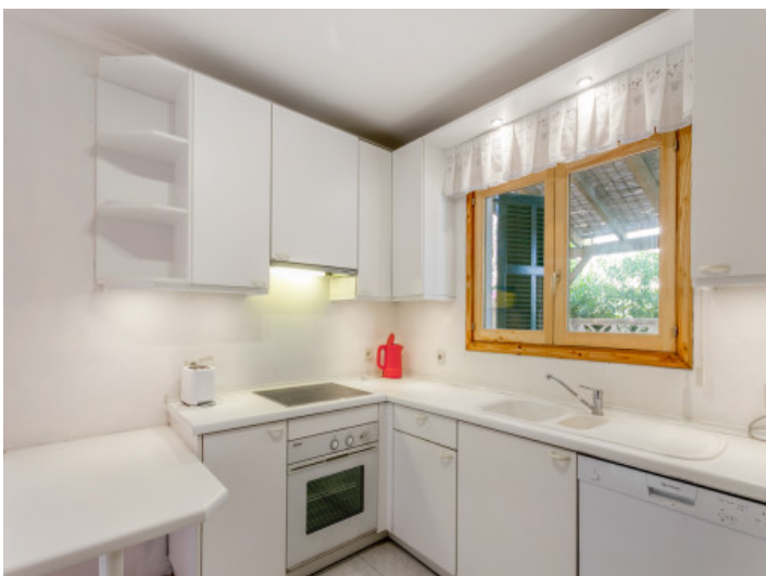
Cocina totalmente equipada