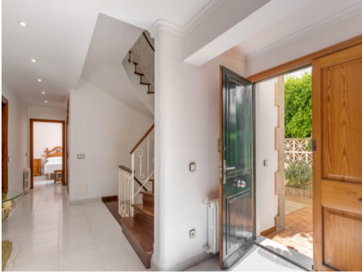
Entrada a la villa