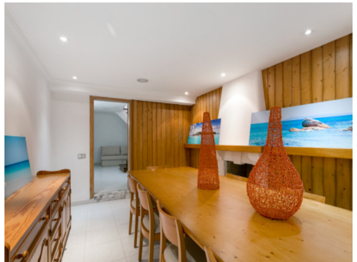
Comedor espacioso en el sótano