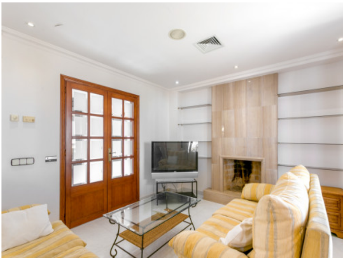
Área de estar con chimenea