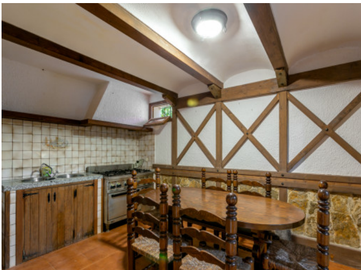
Cocina rústica en el sótano