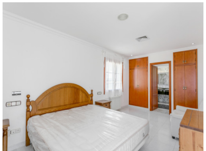
Dormitorio doble con baño en suite

Toda la información como mejor se puede saber, salvo por error durante el periodo de venta. Sirva este documento como un informe previo, las bases legales solo serán válidas a través de un contrato de compra acordado ante Notario.