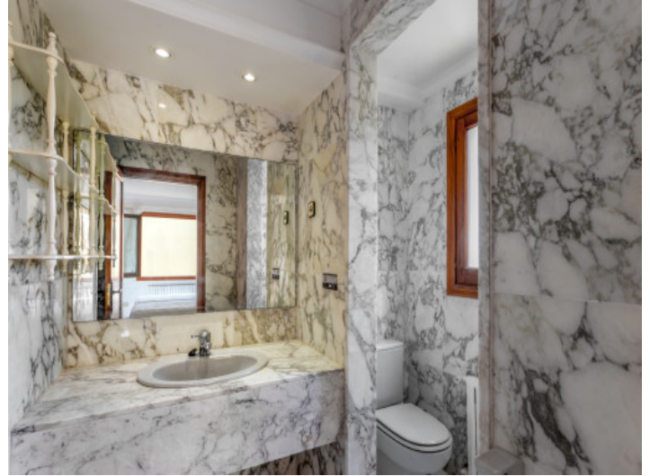
Uno de 3 baños