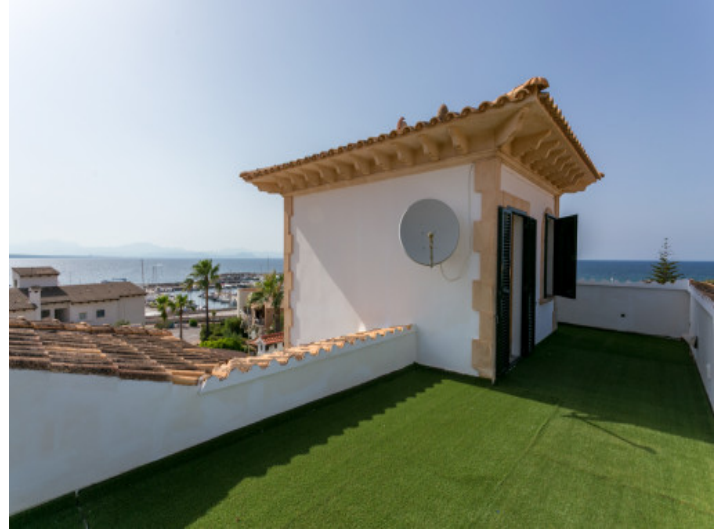
Azotea con fantásticas vistas al mar