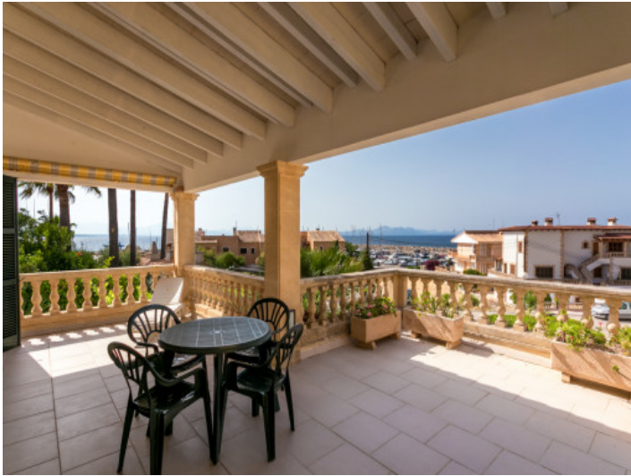
Gran terraza cubierta con vistas al puerto