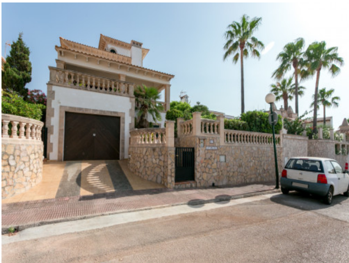
Vista exterior de la villa