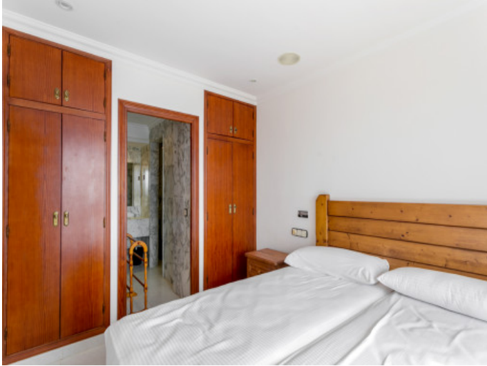
Otro dormitorio con armario empotrado