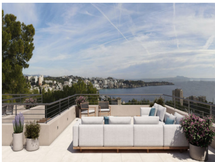
Vistas al mar