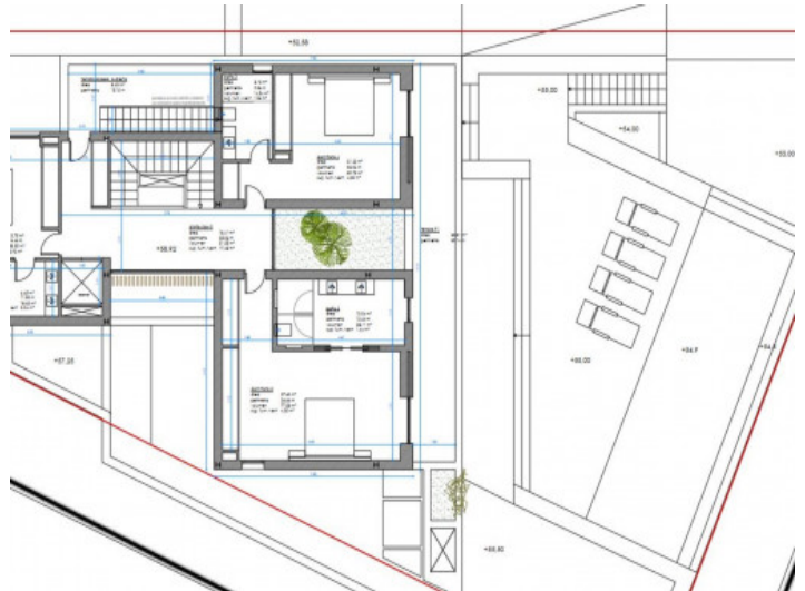
Plano primer piso

Toda la información como mejor se puede saber, salvo por error durante el periodo de venta. Sirva este documento como un informe previo, las bases legales solo serán validas a traves de un contrato de compra acordado ante Notario.