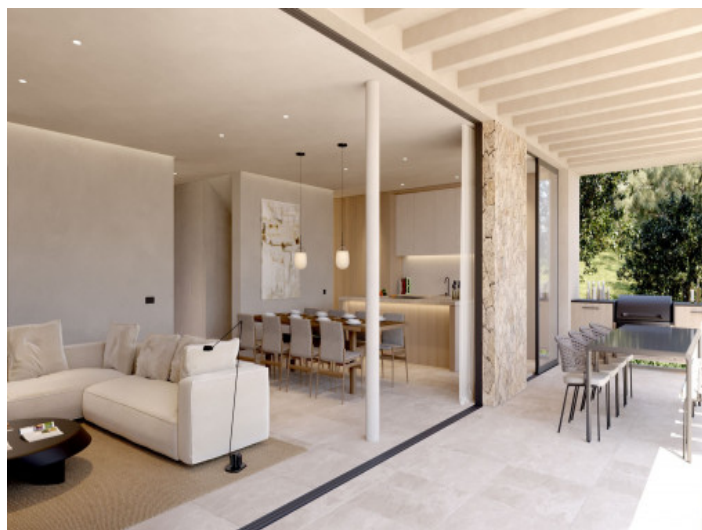
Salón - Comedor

Toda la información como mejor se puede saber, salvo por error durante el periodo de venta. Sirva este documento como un informe previo, las bases legales solo serán válidas a través de un contrato de compra acordado ante Notario.