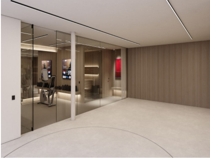
Gimnasio y sauna