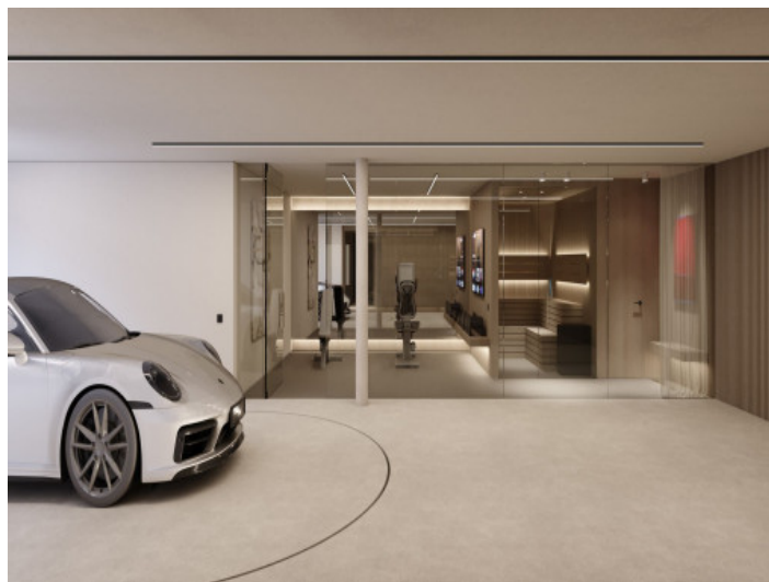
Gimnasio y saun