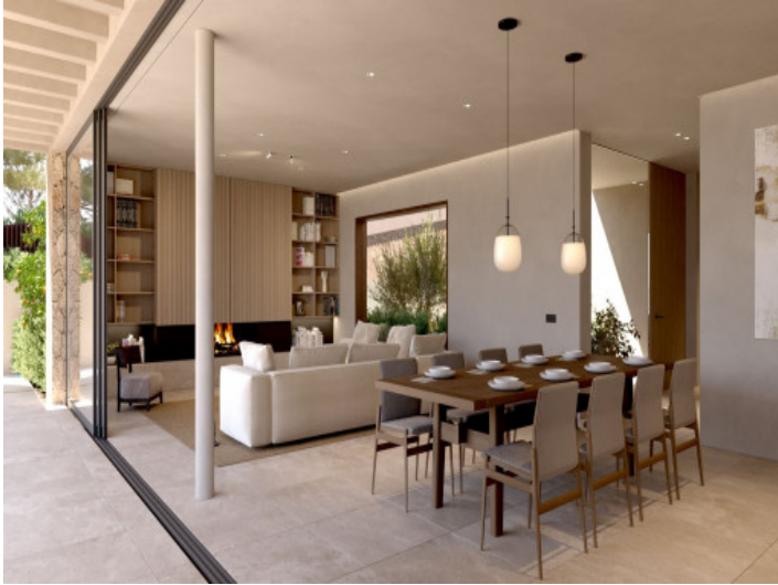
Salón - Comedor