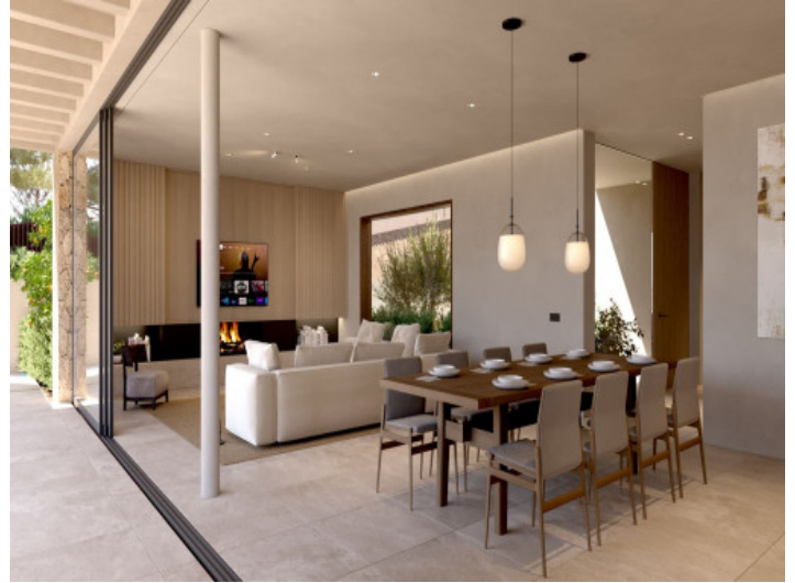
Salón - Comedor