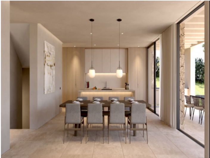
Comedor y cocina