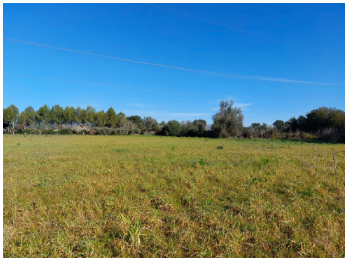
Vista del terreno