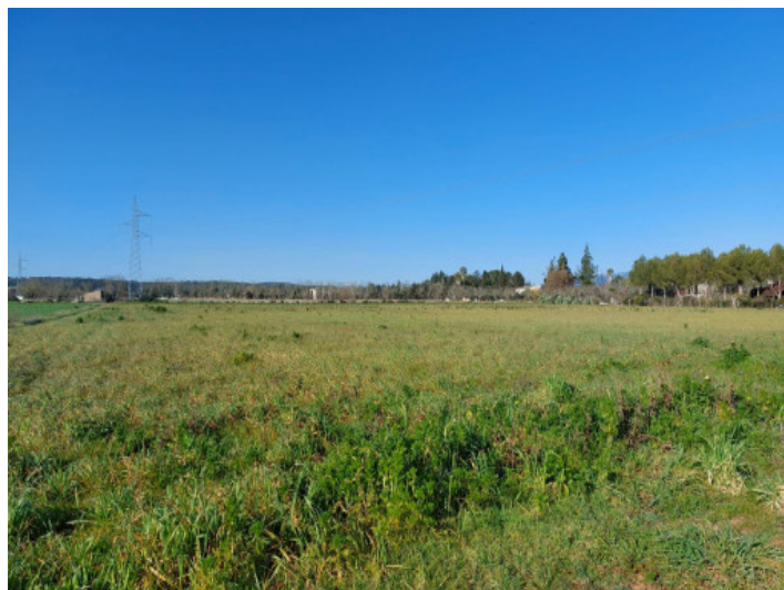
Vista del terreno