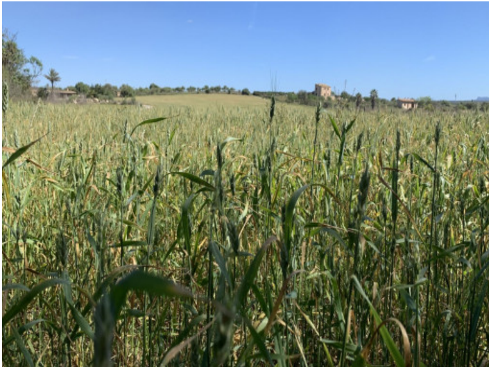
Terreno con proyecto