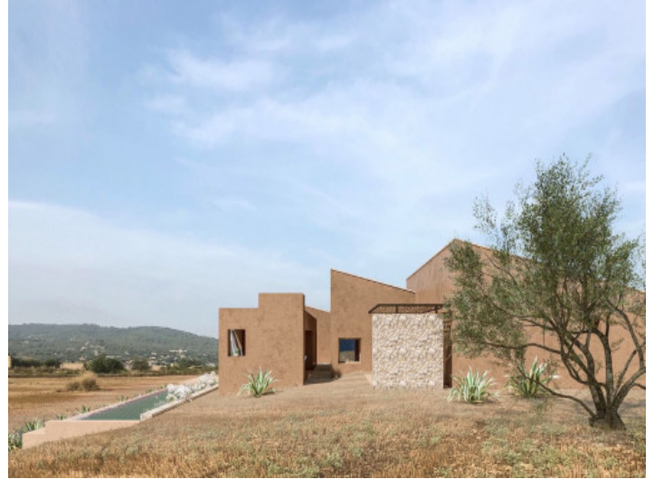
Vista exterior de la finca