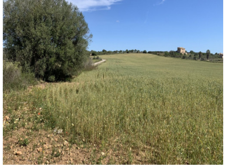
Terreno con proyecto