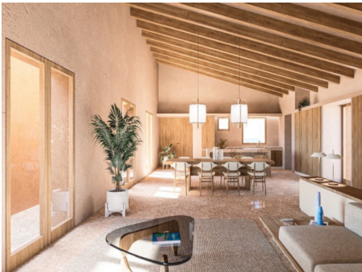
Salón inundado por luz natural