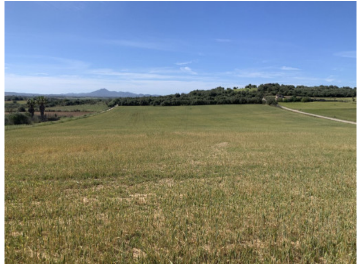
Terreno con proyecto