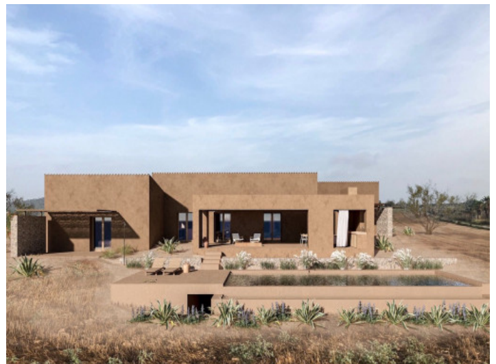
Vista exterior de la finca

Toda la información como mejor se puede saber, salvo por error durante el periodo de venta. Sirva este documento como un informe previo, las bases legales solo serán válidas a través de un contrato de compra acordado ante Notario.