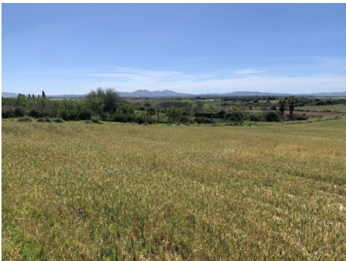
Terreno con proyecto

Toda la información como mejor se puede saber, salvo por error durante el periodo de venta. Sirva este documento como un informe previo, las bases legales solo serán válidas a través de un contrato de compra acordado ante Notario.