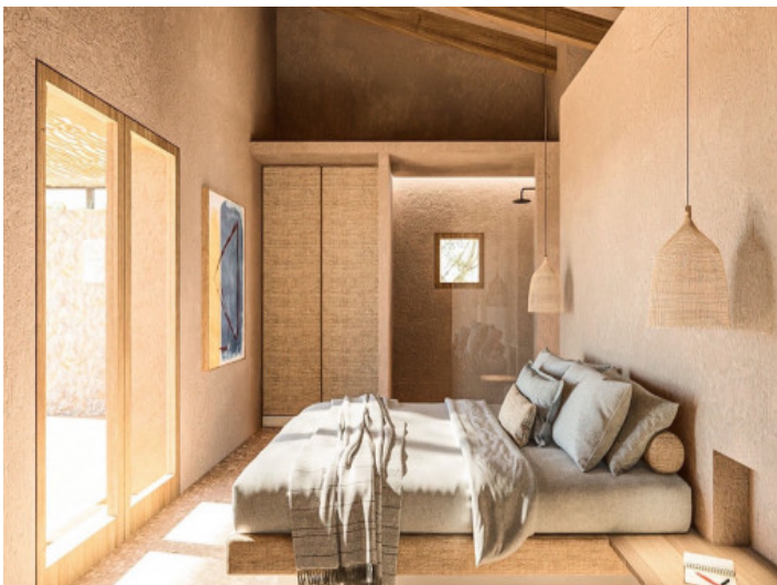
Dormitorio elegante con baño en suite