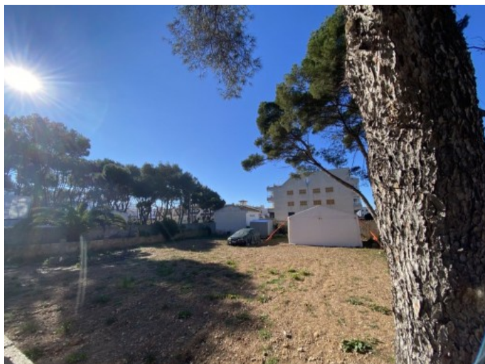
Vista del terreno