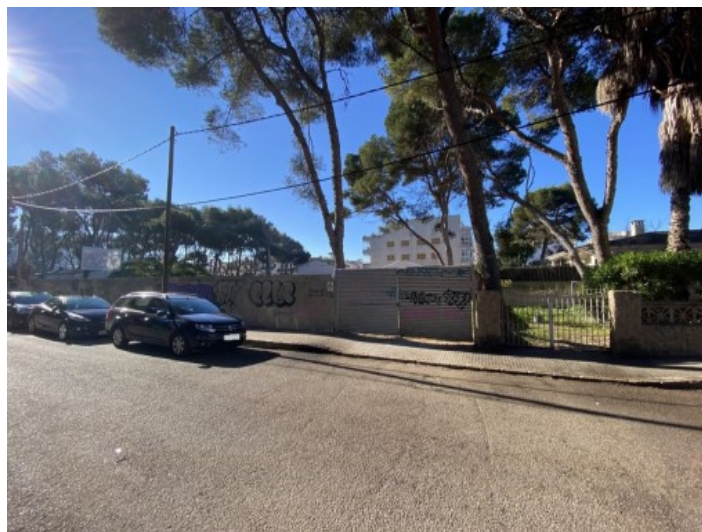
Vista de la calle