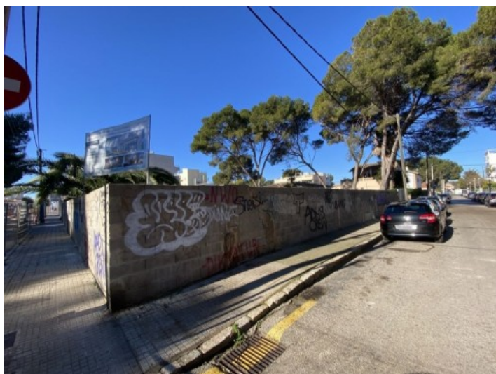
Vista de la calle