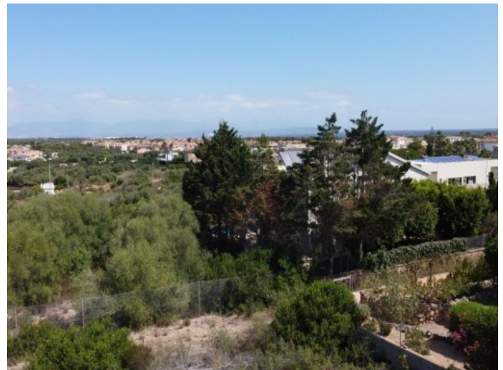
Vista desde el terreno