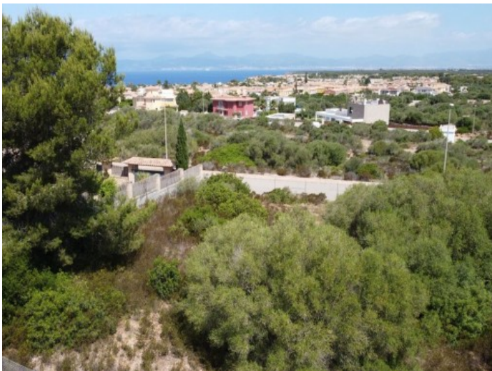
Vista desde el terreno