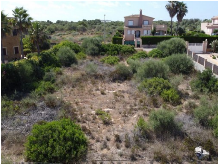
Vista al propiedad