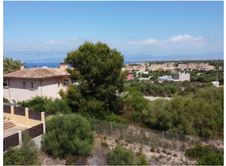
Vista desde el terreno