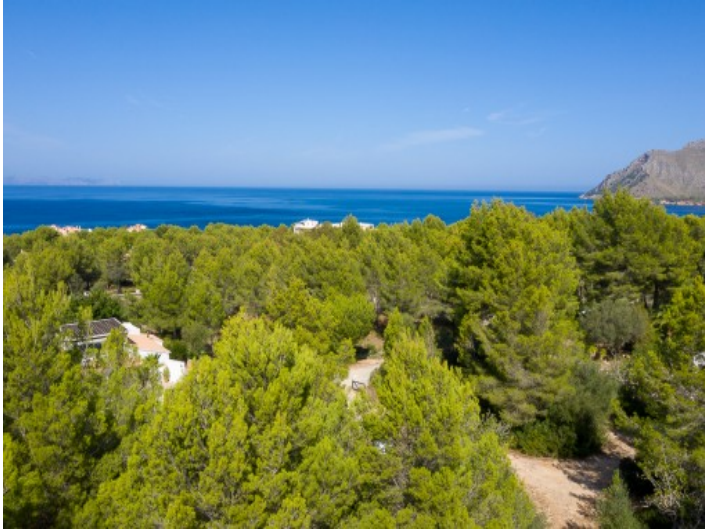
Espectaculares vistas panorámicas al mar