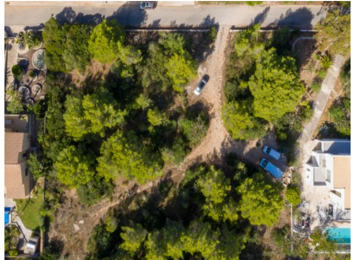
Vista del terreno