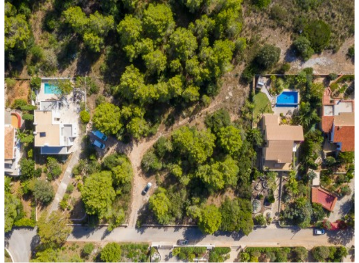
Vista del terreno