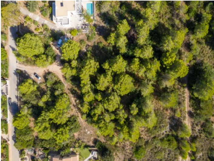
Vista del terreno