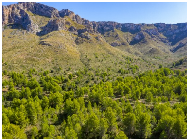
Fantásticas vista a la montaña

Toda la información como mejor se puede saber, salvo por error durante el periodo de venta. Sirva este documento como un informe previo, las bases legales solo serán validas a traves de un contrato de compra acordado ante Notario.