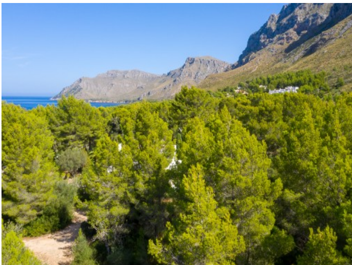
Vista del terreno