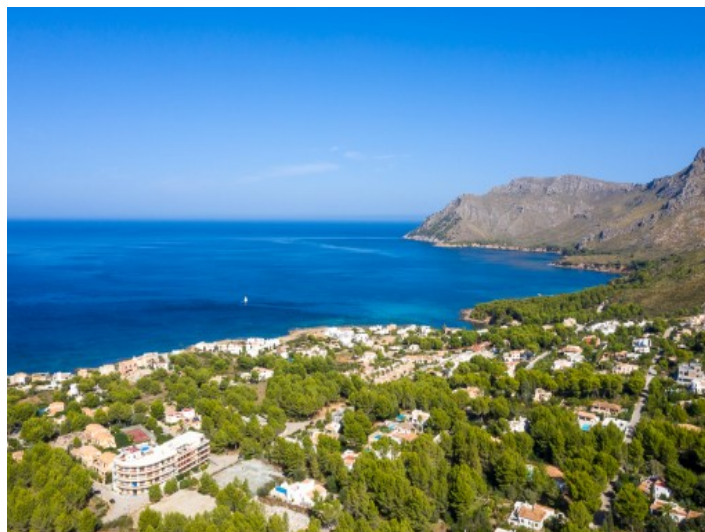
Vista de la costa