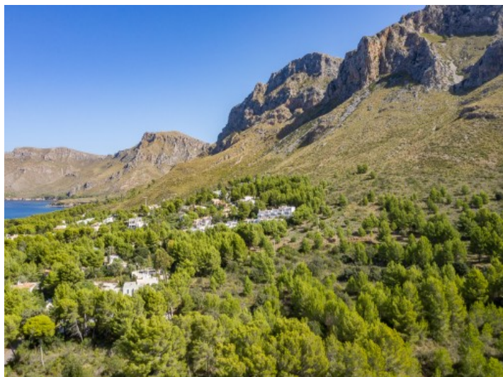
Vista del paisaje