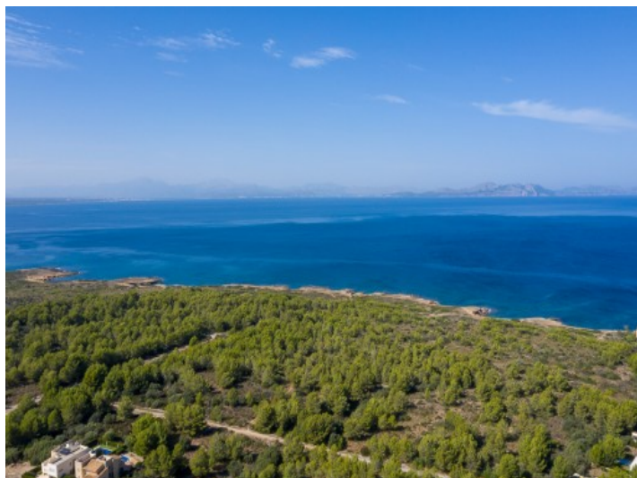
Vista de la costa