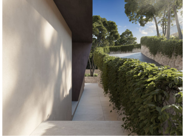
Entrada al la villa