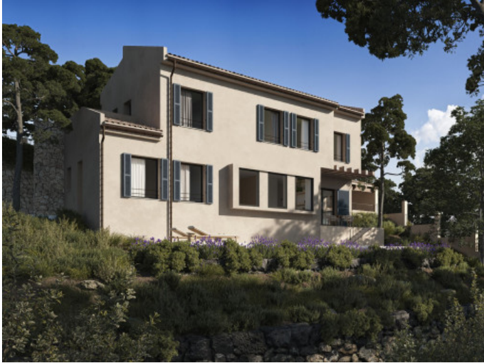
Fachada del proyecto