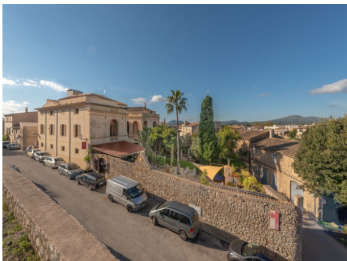
Vista exterior al hotel

Toda la información como mejor se puede saber, salvo por error durante el periodo de venta. Sirva este documento como un informe previo, las bases legales solo serán válidas a través de un contrato de compra acordado ante Notario.