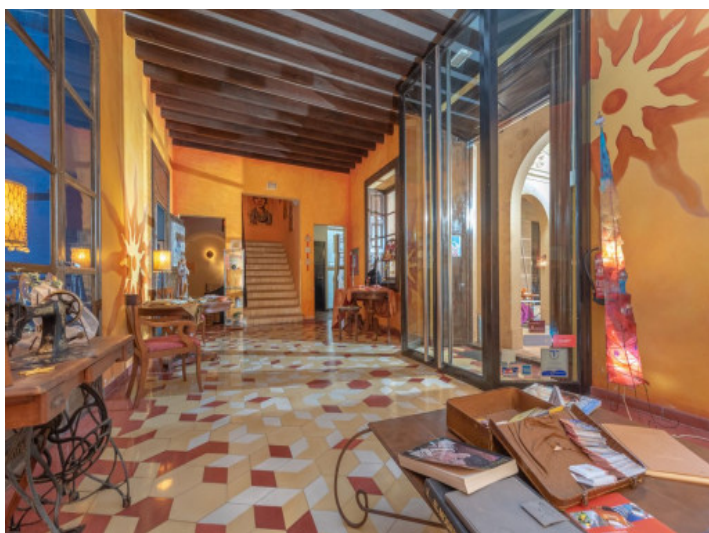
Entrada del hotel