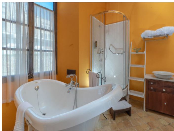
Baño en suite