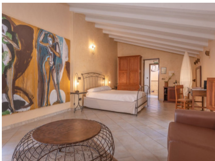
Uno de 8 dormitorios con baño en suite