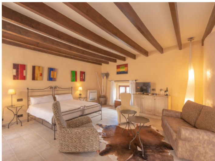
Uno de 8 dormitorios con baño en suite