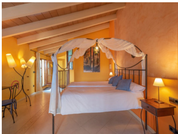
Vista alternativa al dormitorio