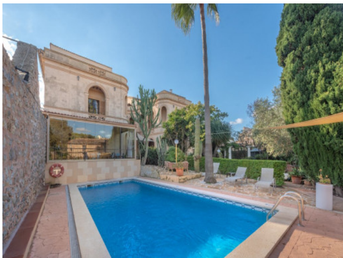
Bonita zona de piscina