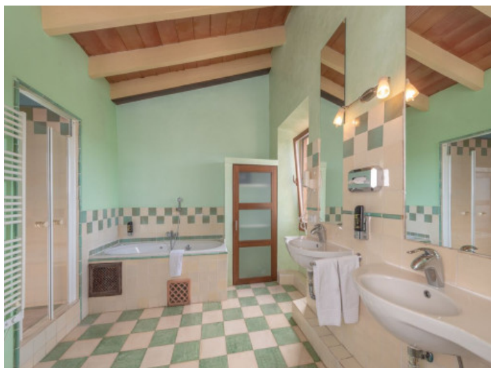
Baño con ducha y bañera