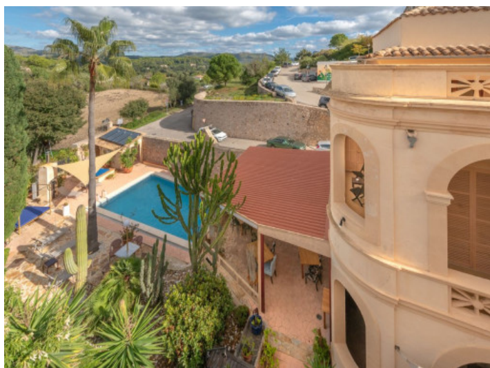
Vista al comedor y la piscina