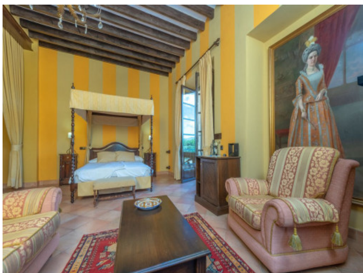
Vista alternativa al dormitorio