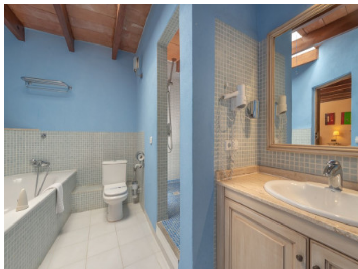
Baño en suite con bañera