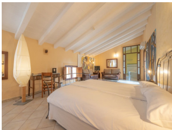
Uno de 8 dormitorios con baño en suite