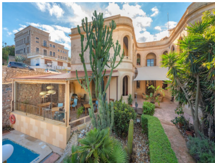
Vista exterior y piscina