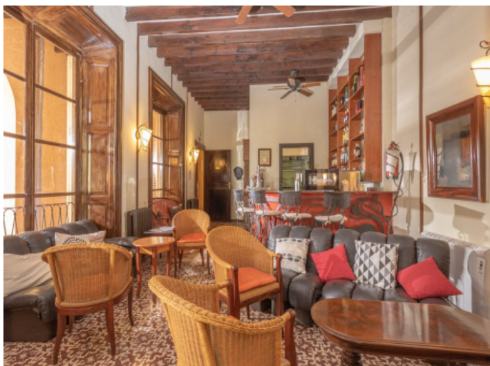
Vista alternativa al bar