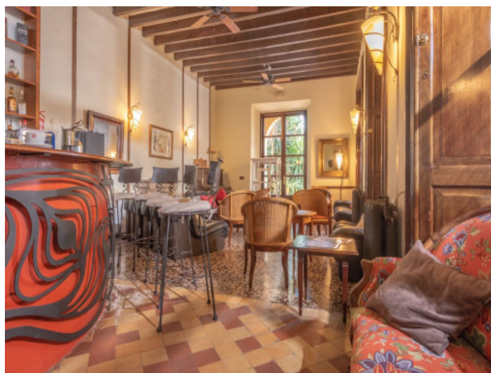
Bar y restaurante