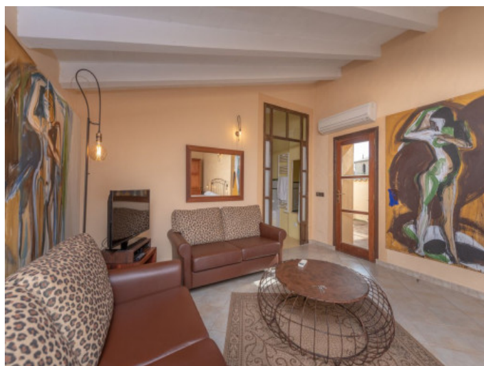
Vista alternativa al dormitorio