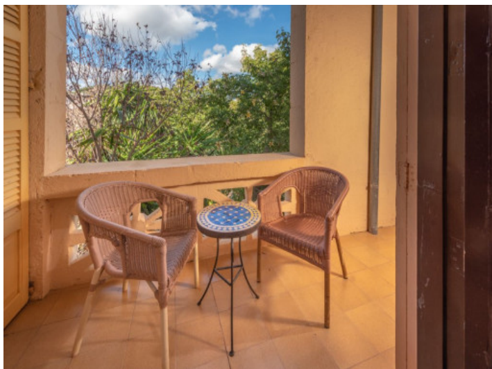
Atractivo balcón propio