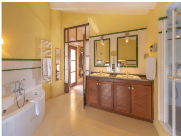
Baño con bañera