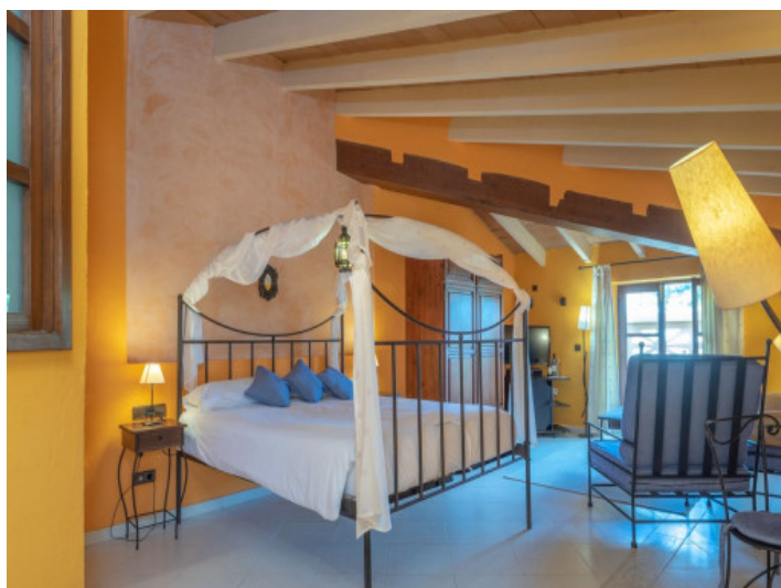
Uno de 8 dormitorios con baño en suite