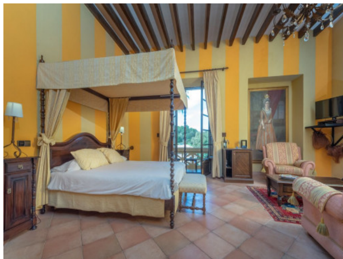
Uno de 8 dormitorios con baño en suite