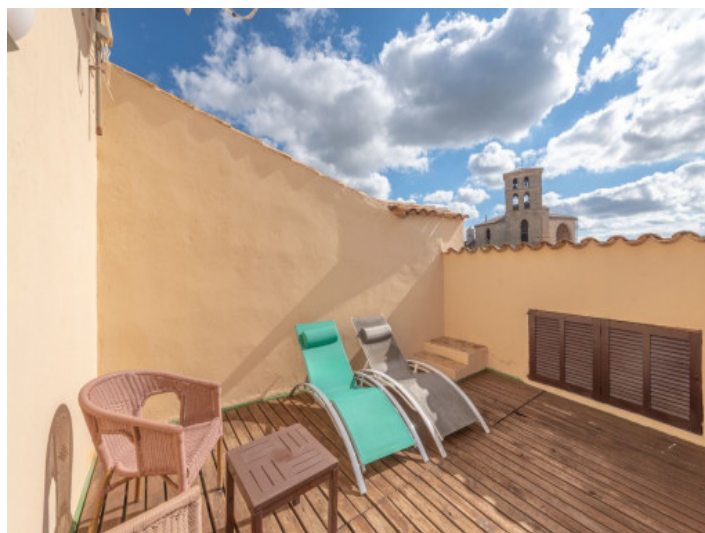
Terraza propia de la suite

Toda la información como mejor se puede saber, salvo por error durante el periodo de venta. Sirva este documento como un informe previo, las bases legales solo serán validas a traves de un contrato de compra acordado ante Notario.