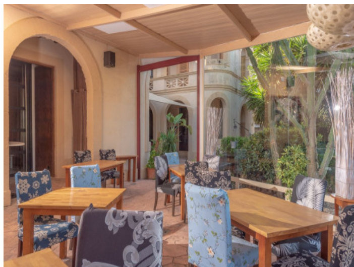
Zona del comedor

Toda la información como mejor se puede saber, salvo por error durante el periodo de venta. Sirva este documento como un informe previo, las bases legales solo serán válidas a través de un contrato de compra acordado ante Notario.