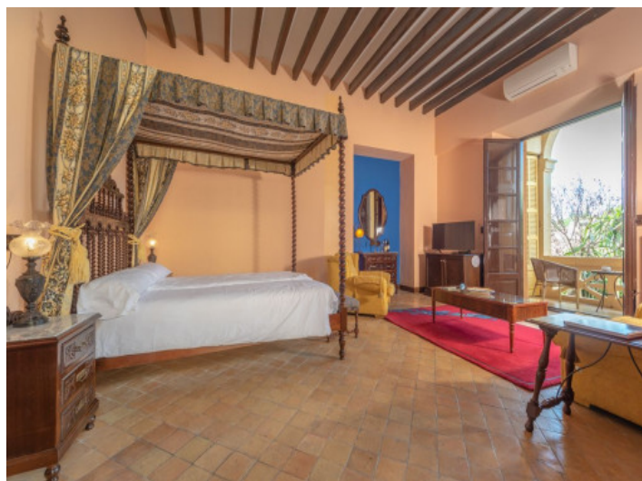
Uno de 8 dormitorios con baño en suite

Toda la información como mejor se puede saber, salvo por error durante el periodo de venta. Sirva este documento como un informe previo, las bases legales solo serán válidas a través de un contrato de compra acordado ante Notario.