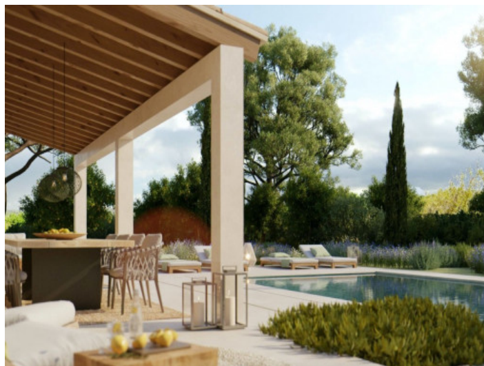
Zona de piscina