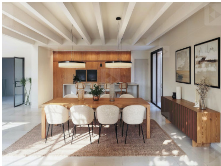
Comedor y cocina