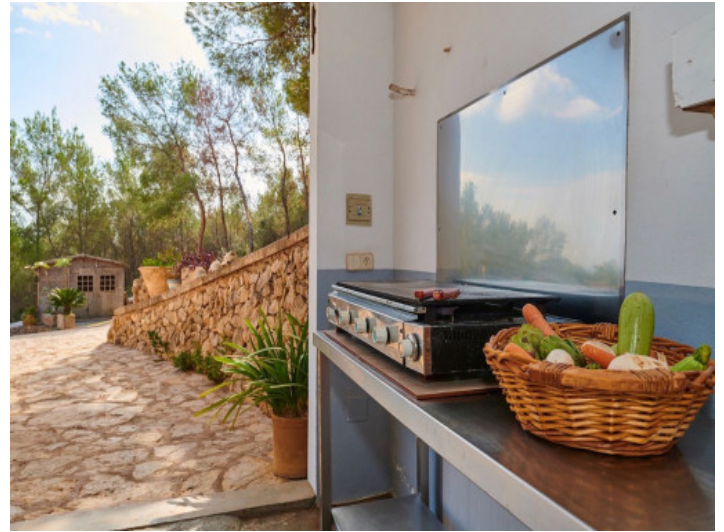
Cocina de verano