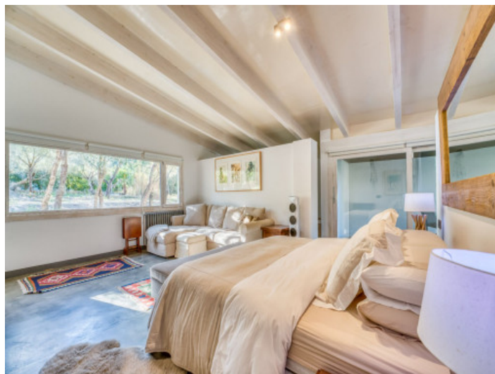
La generosidad define la suite principal