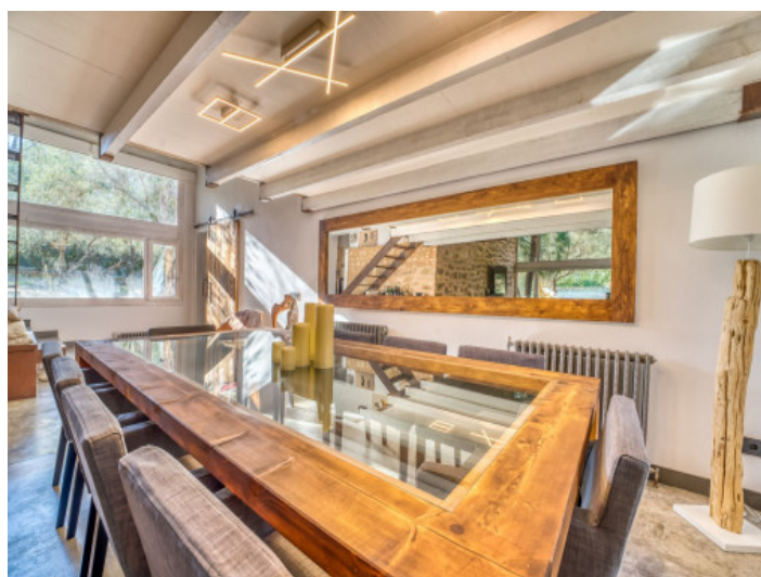
Amplia zona de comedor

Toda la información como mejor se puede saber, salvo por error durante el periodo de venta. Sirva este documento como un informe previo, las bases legales solo serán válidas a través de un contrato de compra acordado ante Notario.