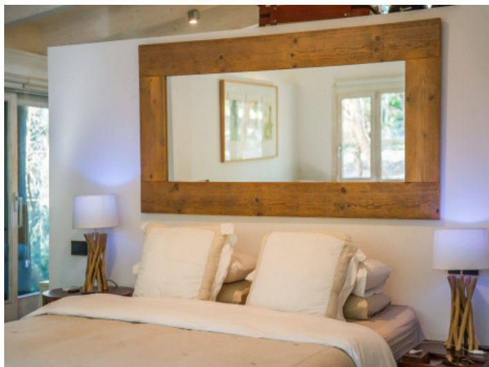
Mobiliario clásico de la suite principal