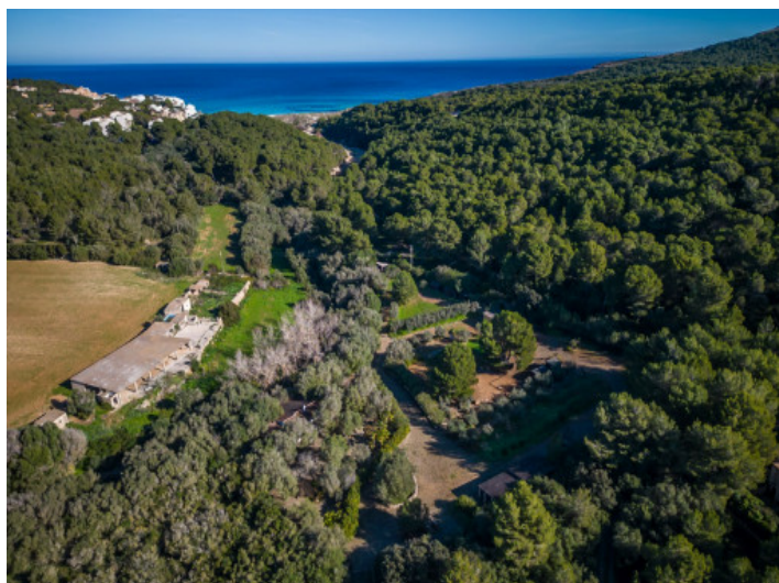
Rotonda de entrada imponente