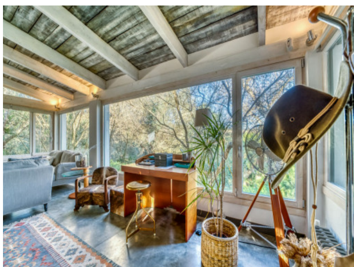
Rincón de oficina luminoso