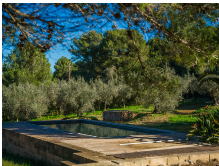
La piscina rodeada de naturaleza y olivos