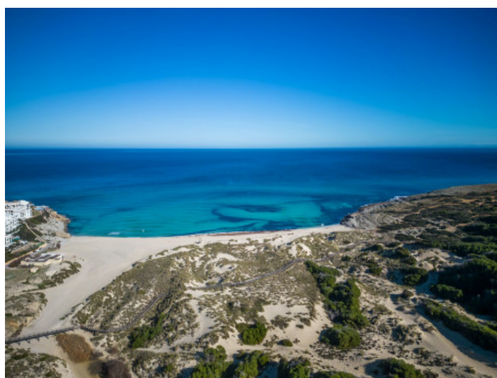
A poca distancia a pie de Cala Mesquida