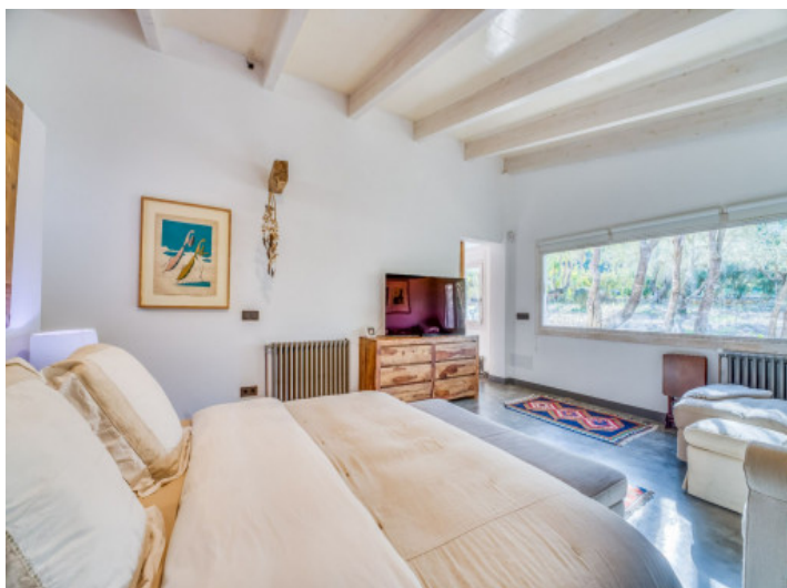
Suite principal de estilo rústico