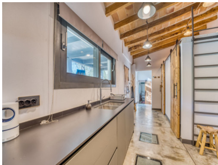
Despensa y aseo de invitados a la derecha