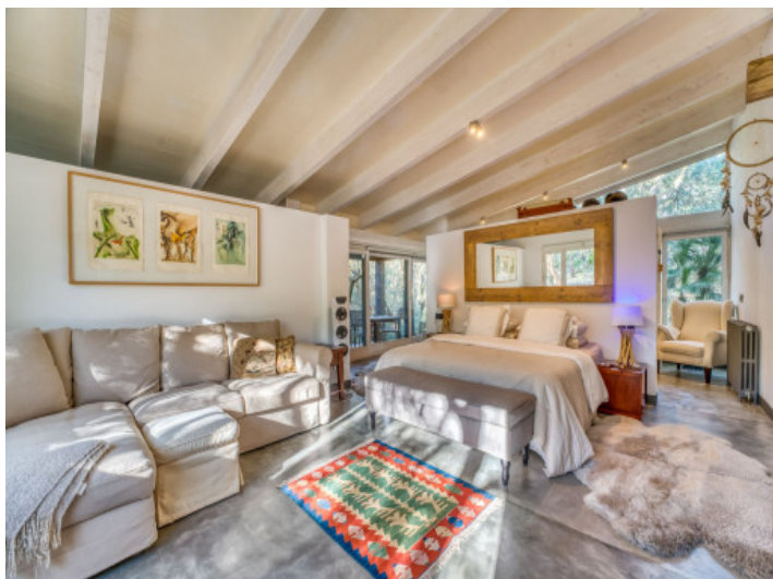
La suite principal de la villa moderna