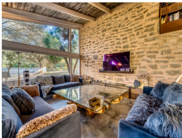
Zona de estar romántica