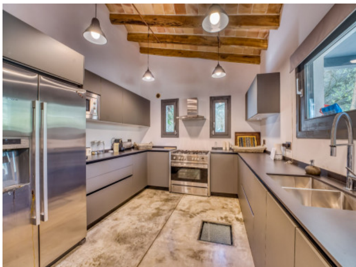
Modern, fully equipped kitchen