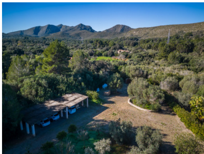
Entrada y plazas de aparcamiento cubiertas

Toda la información como mejor se puede saber, salvo por error durante el periodo de venta. Sirva este documento como un informe previo, las bases legales solo serán válidas a través de un contrato de compra acordado ante Notario.