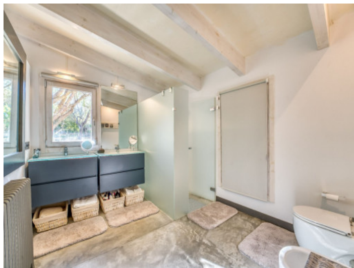
Baño moderno en suite