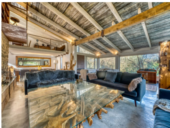
Concepto interior luminoso y generoso