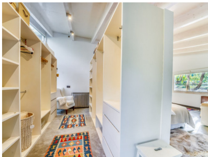
Zona de vestidor de la suite principal

Toda la información como mejor se puede saber, salvo por error durante el periodo de venta. Sirva este documento como un informe previo, las bases legales solo serán válidas a través de un contrato de compra acordado ante Notario.