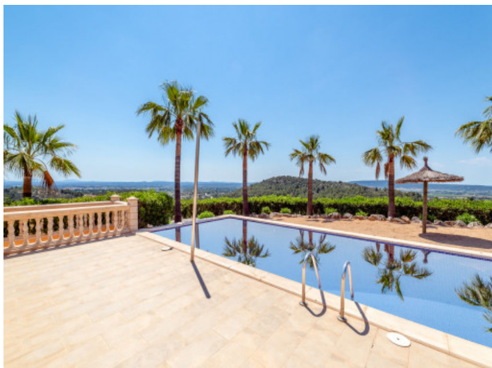
Área de piscina