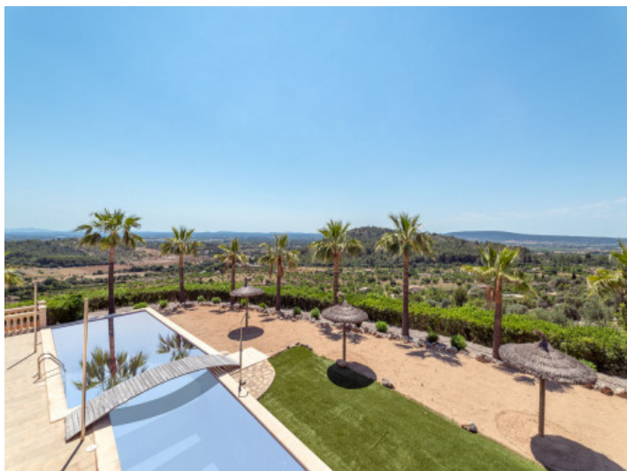
Gran propiedad con vistas panorámicas en Alaró