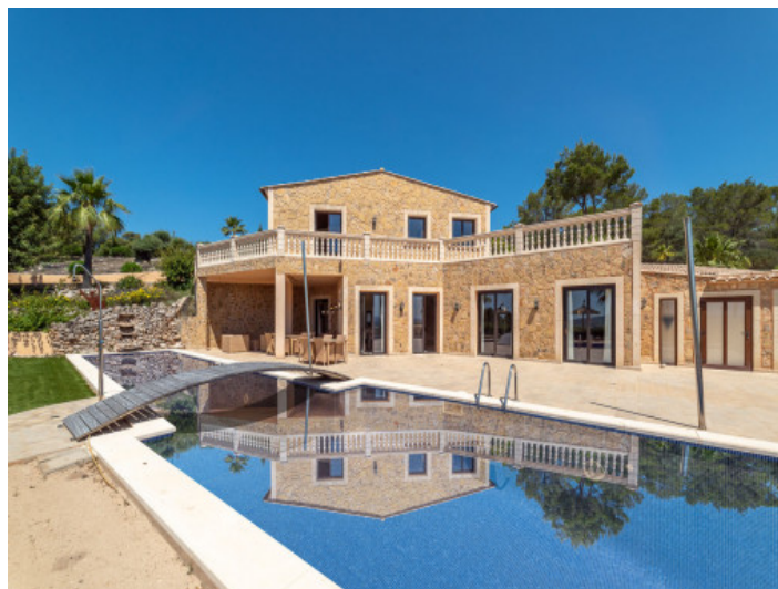
Vista exterior y piscina