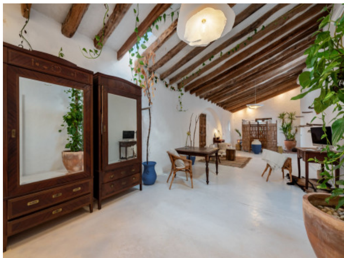
Habitación primera planta