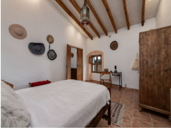
Dormitorio primera planta