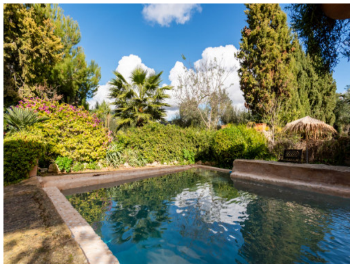
Algibe convertido en piscina