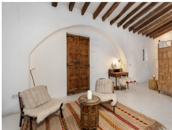
Techos altos y vigas de madera

Toda la información como mejor se puede saber, salvo por error durante el periodo de venta. Sirva este documento como un informe previo, las bases legales solo serán válidas a través de un contrato de compra acordado ante Notario.