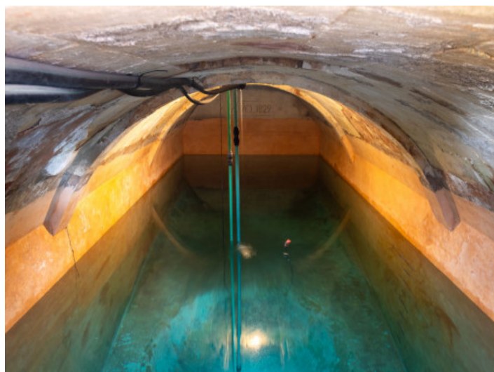
Algibe subterráneo de 1829

Toda la información como mejor se puede saber, salvo por error durante el periodo de venta. Sirva este documento como un informe previo, las bases legales solo serán válidas a través de un contrato de compra acordado ante Notario.