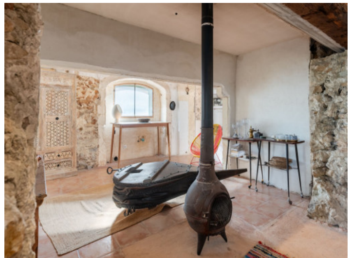
Rincon de chimenea cerca del comedor

Toda la información como mejor se puede saber, salvo por error durante el periodo de venta. Sirva este documento como un informe previo, las bases legales solo serán válidas a través de un contrato de compra acordado ante Notario.