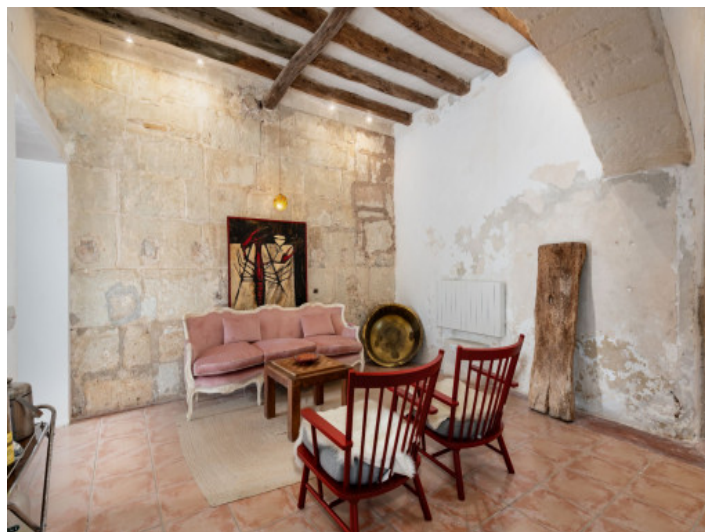
Piedra de Santanyi restaurada