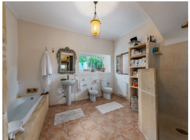
Uno de 2 baños