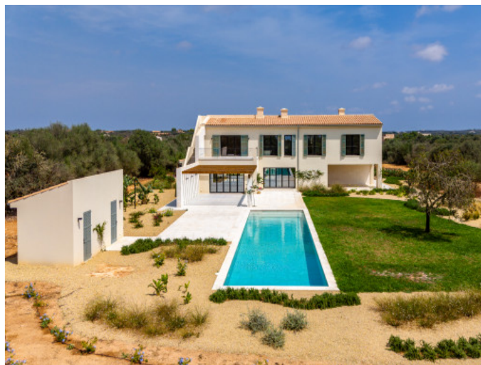
Vistas desde el jardin a la finca