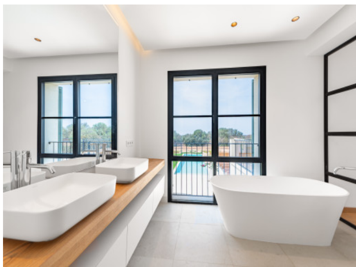
Baño dormitorio principal