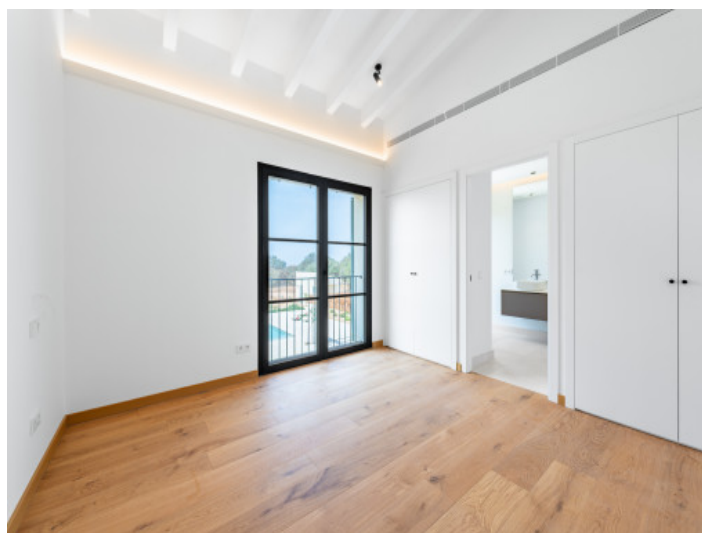
Dormitorio con baño en suite