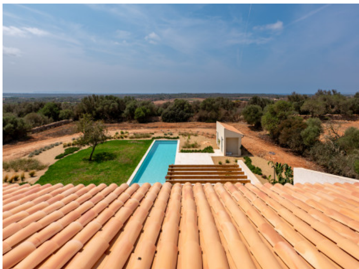
Vistas hasta el mar