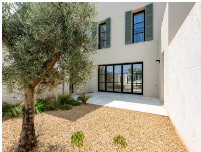
Patio cerca de la cocina