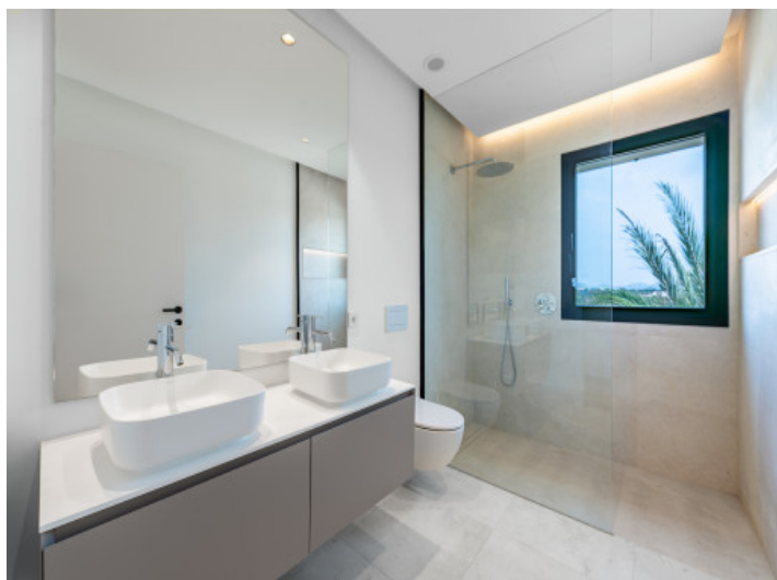
Baño en suite