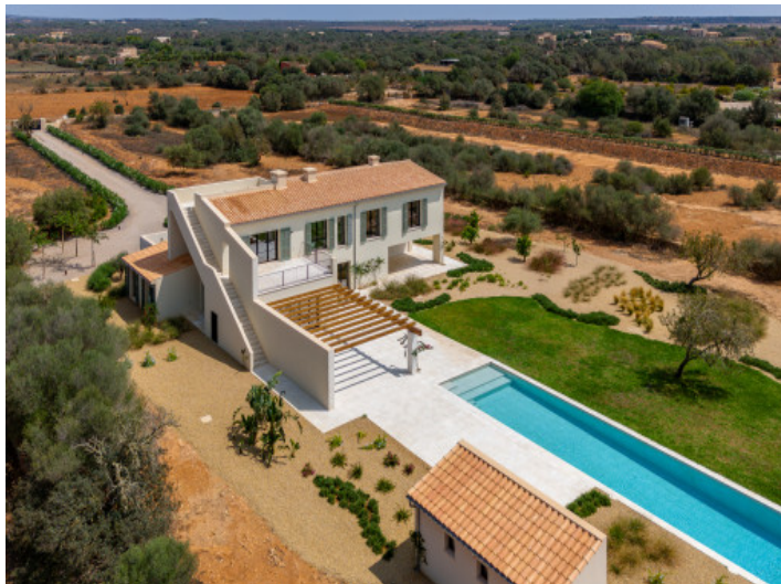
Vista a la propiedad