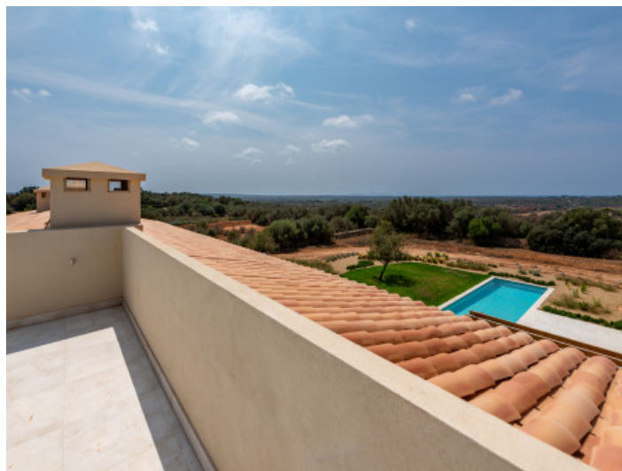
Vistas desde el primer piso