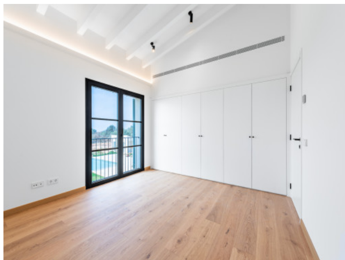
Uno de 5 dormitorios

Toda la información como mejor se puede saber, salvo por error durante el periodo de venta. Sirva este documento como un informe previo, las bases legales solo serán válidas a través de un contrato de compra acordado ante Notario.