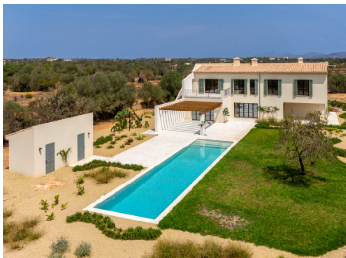
Bonita finca de nueva construcción