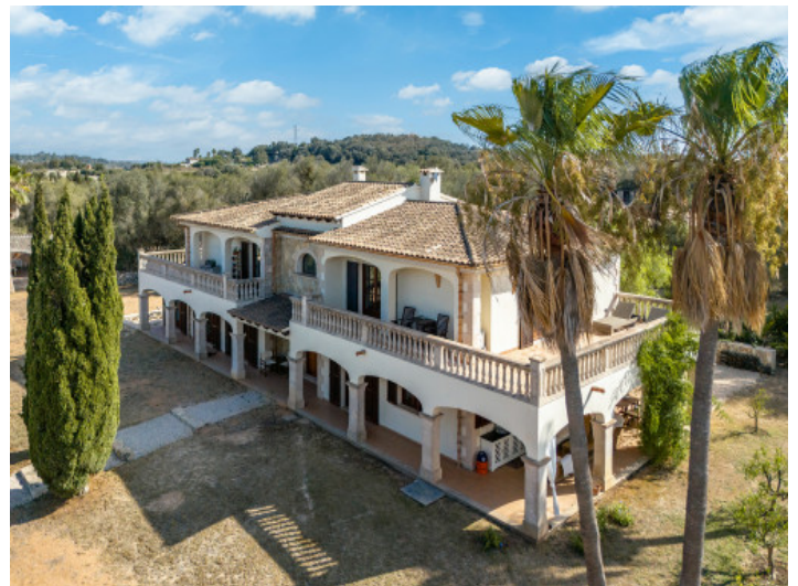
Vista a la propiedad