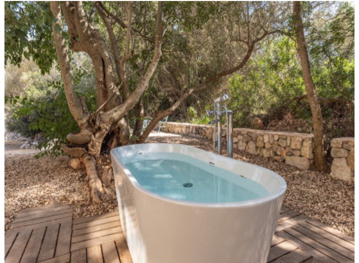
Refrescarse en el jardín