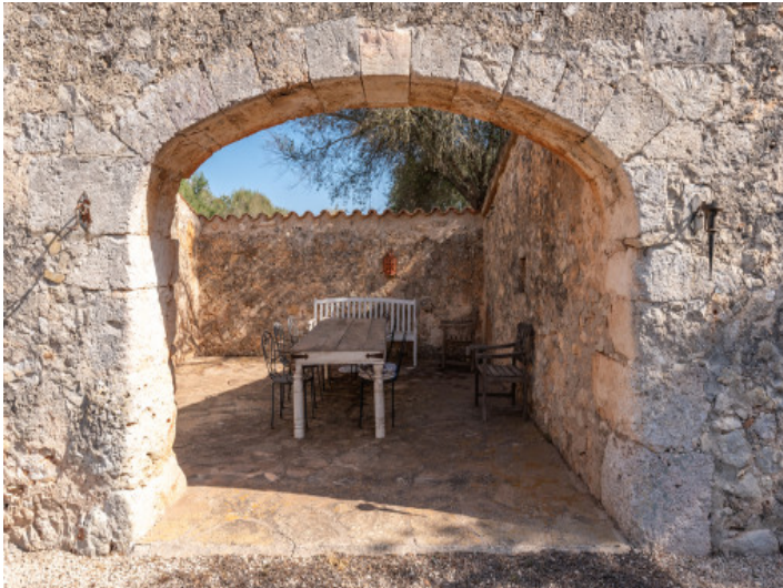
Comedor al aire libre