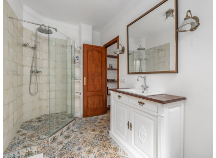
Baño en suite