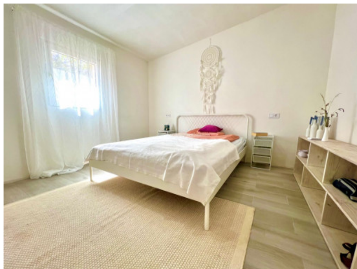
Uno de 3 dormitorios