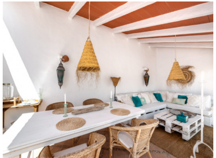
Terraza y área de estar