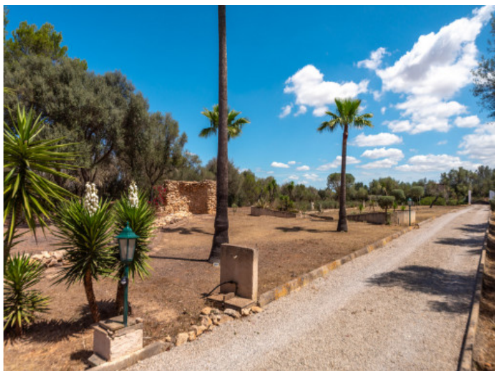
Acceso a la finca