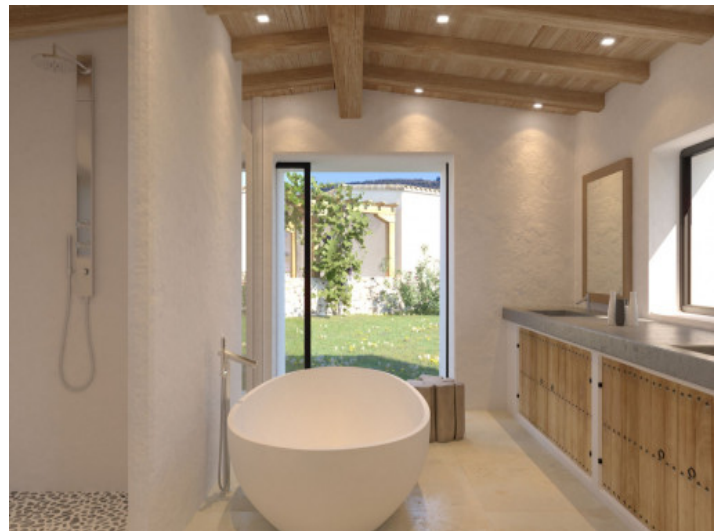
Villa con 4 baños