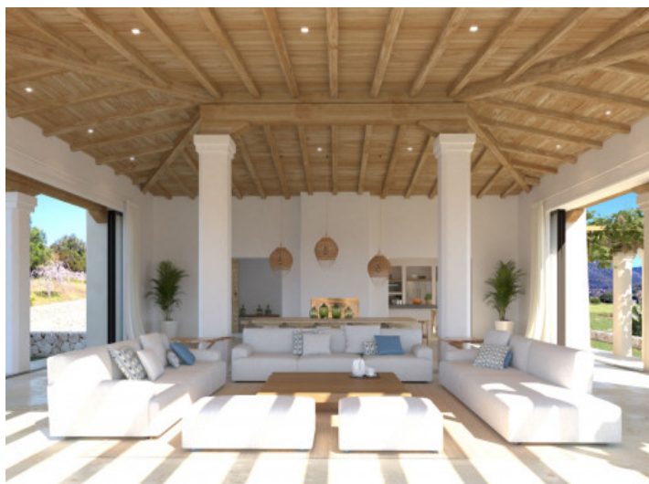
Prestigioso proyecto de nueva construcción rodeado de la naturaleza única