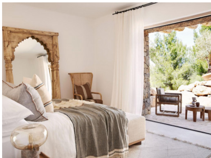
Uno de 6 dormitorios

Toda la información como mejor se puede saber, salvo por error durante el periodo de venta. Sirva este documento como un informe previo, las bases legales solo serán válidas a través de un contrato de compra acordado ante Notario.