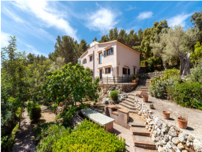
Fachada y jardín