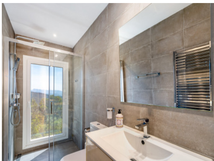
Uno de 2 baños