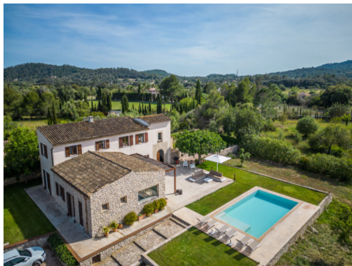
Finca con piscina cerca de Artá