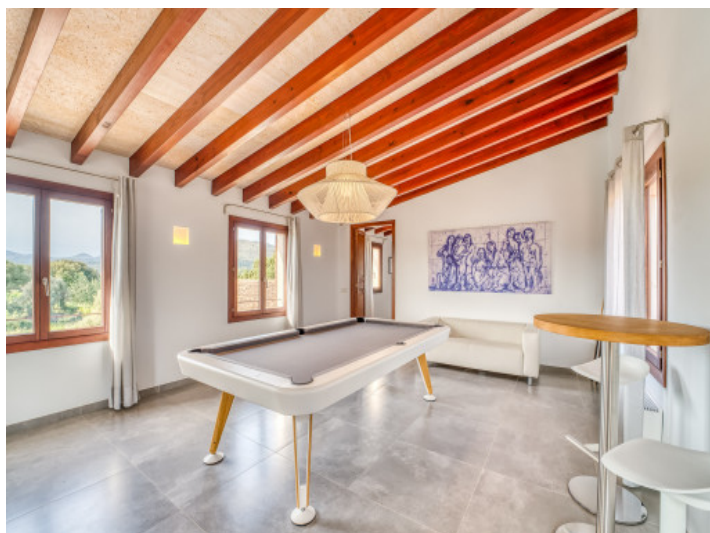
Sala de entretenimiento