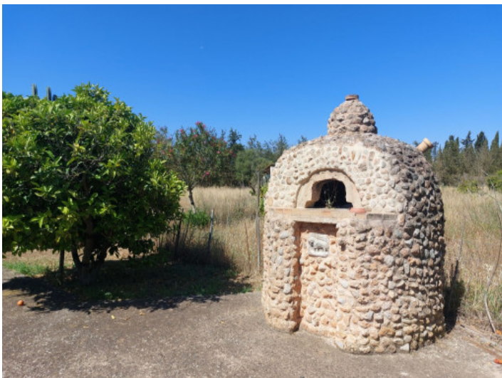
horno de pizza