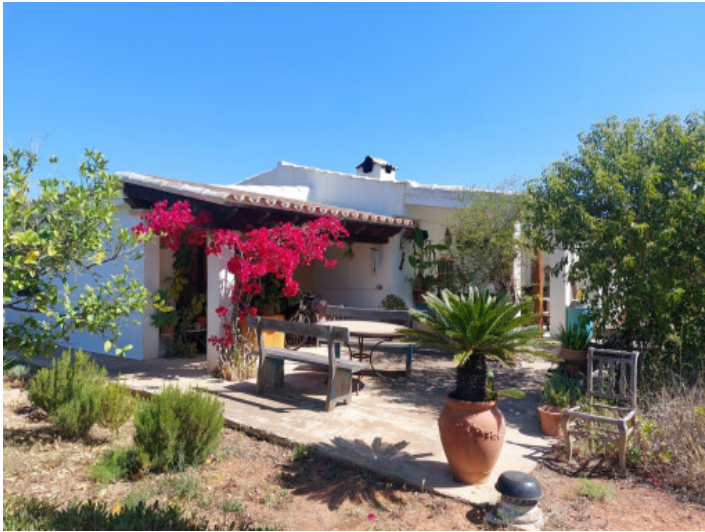
Encantadora finca en ubicación excelente cerca de Binissalem