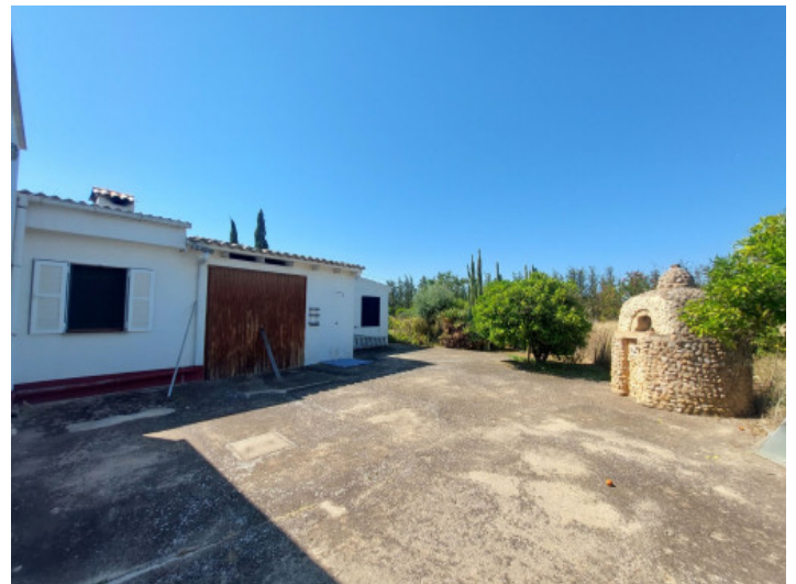
Fachada frontal y horno de pizza