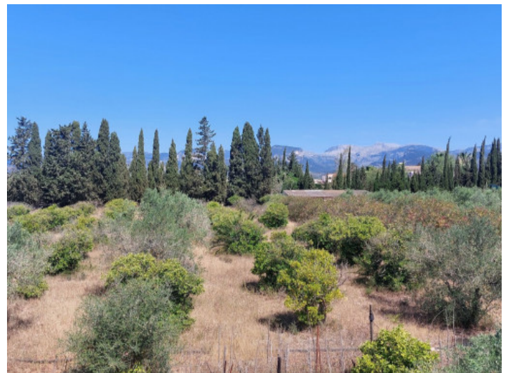
Terreno y vistas

Toda la información como mejor se puede saber, salvo por error durante el periodo de venta. Sirva este documento como un informe previo, las bases legales solo serán válidas a través de un contrato de compra acordado ante Notario.