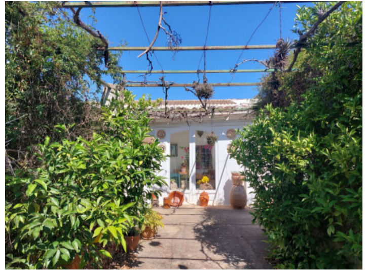
Vistas a la casa