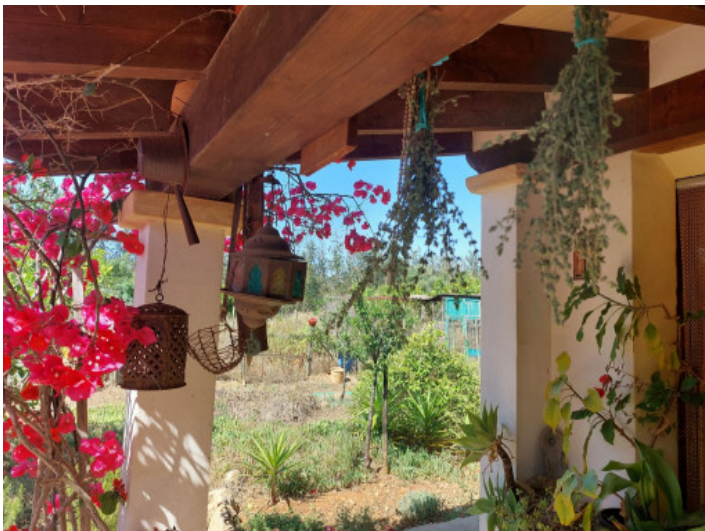
Una propiedad lleno de posibilidades